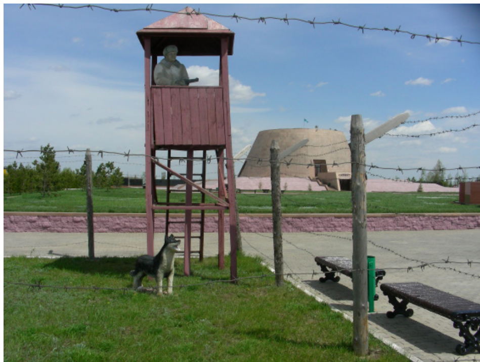
Fot. 3. Ałżir – obóz dla żon i dzieci zdrajców ojczyzny (podobóz Karłagu)

Zupełnie innego rodzaju „atrakcją turystyczną” jest znajdujący się w pobliżu Astany Ałżir – dawny (1938–1953) kobiecy podobóz Karłagu (Fot. 3). Od lat 30. XX w. Kazachstan, a zwłaszcza jego północna i środkowa część, był bowiem miejscem deportacji ludności wywożonej tu z terenów Związku Radzieckiego, a także obszarem karnych obozów pracy. Centrum gułagów stanowiły okolice Karagandy, o czym wspomniano wcześniej, gdzie mieściły się „główne” obozy pracy, a 40 km od Akmoły (dzisiejszej Astany) znajdował się AŁŻIR – „akmoliński łagier (obóz) dla żon i dzieci zdrajców Ojczyzny”. Dzisiaj na miejscu obozu jest wstrząsające muzeum z pamiątkami po więzionych, a często zamęczonych, tu kobietach i ich dzieciach – ono również bywa uwzględniane na trasach zwiedzania. Muzeum upamiętniające ofiary Karłagu znajduje się w miejscowości Dolinka pod Karagandą, gdzie mieściło się centrum administracyjno-gospodarcze obozu (Rusakowicz, 2014).