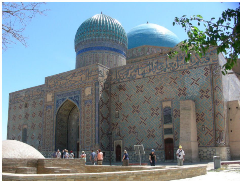
Fot. 5. Turkmenistan – Mauzoleum Chodży Ahmada Jasawiego

Ważnym niegdyś ośrodkiem na Jedwabnym Szlaku było miasto Otrar (Farab, VIII-XVIII w.), położone u podnóża gór Karatau. Dziś turyści mogą oglądać ruiny tego – miasta, częściowo odrestaurowane i zabezpieczone mury pałacu, meczet i ruiny łaźni. W Otrarze w roku 1405 zmarł Timur. W pobliżu ruin znajduje się okazałe, średniowieczne (XIV w.) Mauzoleum Arystan Baba (mistyka, nauczyciela innego mistyka i poety – Chodży Jasawiego).