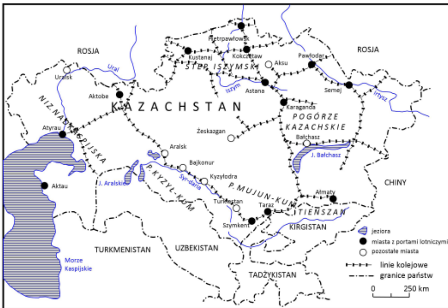
Ryc. 1. Mapa Kazachstanu (opracowanie własne)

się liczne słone jeziora (m.in. pozostałości Jeziora Aralskiego i jezioro Bałchasz, którego zachodnia część jest słodkowodna) i sieć koryt rzek okresowych. Dalej ku północy rozciąga się pas nizin i wyżynnych stepów (ok. 30% powierzchni kraju). Obejmuje on zachodnią i północną część kraju, sięgając od Niziny Nadkaspjskiej, przez wzniesienia Mugodżarów (pd. kraniec Uralu) i Wyżyny Turgajskiej, do bardzo rozległego Pogórza Kazachskiego (m.in. step Sary Arka, pojedyncze pasma gór niskich i średnich – do 1565 m n.p.m., szerokie obniżenia z jeziorami i solniskami oraz półpustynny płaskowyż Betpak Dała w części południowej). Najbardziej północną część kraju zajmuje skraj Niziny Zachodniosyberyjskiej (Step Iszymski, dolina rzeki Irtysz). Generalizując regionalnie typy krajobrazu można uznać, że w północnej połowie kraju dominują cechy rzeźby typowe dla Syberii, a w południowej dla Azji Środkowej.