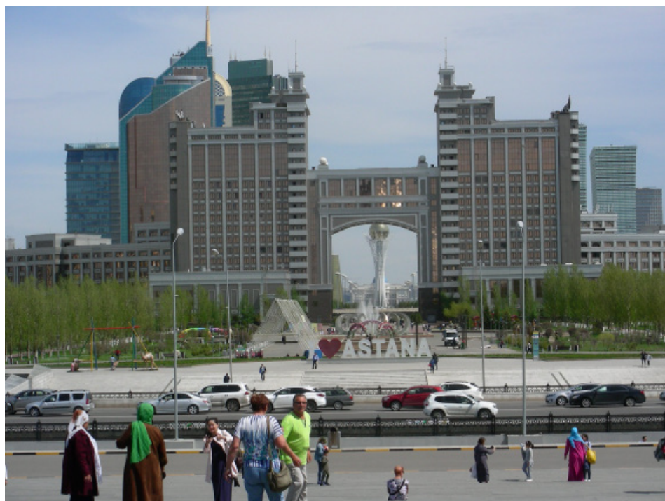
Fot. 1. Astana – panorama miasta, w osi głównej alei wieża widokowa Bajterek – symbol miasta

stolicy to: siedziba prezydenta Kazachstanu Nursułtana Nazarbajewa – Pałac prezydencki Ak Orda (budowa 2001–2004), o marmurowej fasadzie, zwieńczony iglicą (w sumie 80 metrów wysokości); Pałac Pokoju i Pojednania w kształcie piramidy (2004–2006) o wysokości 74 m, Kazachska Filharmonia Narodowa (2006–2009) z główną salą koncertową mieszczącą 3,5 tys. osób, wieżowiec Transport Tower (Wieża transportu) – przypominająca wyglądem wielką zapalniczkę, o wysokości ponad 150 m, oddana do użytku w 2003 roku; stadion piłkarski Astana Arena (2006–2009) na 30 000 widzów, z rozsuwanym dachem. W 2010 r. oddano do użytku Chan Szatyr – nowoczesny budynek nawiązujący wyglądem do stylizowanego namiotu, mieszczący największe w Azji Środkowej centrum handlowo-rozrywkowe o pow. 23 tys. m 2 . Warte zwiedzenia jest zbudowane i urządzone z rozmachem Narodowe Muzeum Republiki Kazachstanu, w którym najcenniejsze znalezisko to m.in. tzw. „Złoty człowiek” - odnaleziony w 1970 roku (w kurhanie w mieście rejonowym Issyk, w obwodzie ałmackim) – złota zbroja wojownika lub wodza sakijskiego (Sakowie – to plemiona zamieszkujące w I tysiącleciu p.n.e. Azję Środkową, zajmujące się m.in. hodowlą bydła rogatego, koni i wielbłądów, tworzące też bogate przedmioty rzemiosła artystycznego, m.in. ze złota) (Kapisani, 2004). Astanę łączą z Polską dwa miasta partnerskie – Gdańsk i Warszawa.