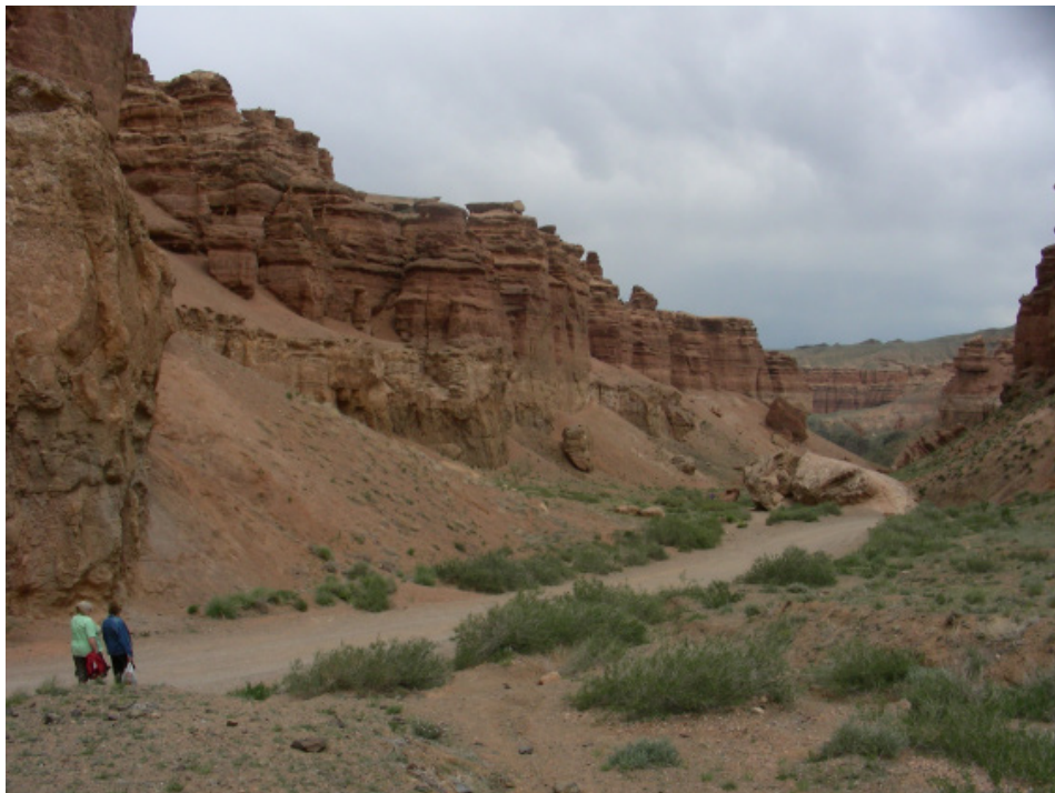
Fot. 4. Dolina Zamków w Kanionie Szaryńskim

Kanion Szaryński znajduje się na przedpolu Tienszanu. Został on wycięty erozyjnie w piaskowcach i zlepieńcach poprzecinanych żyłami wulkanitów przez rzekę Szaryn. Wysokość jego ścian skalnych sięga 200 m. Przypomina wyglądem Wielki Kanion Kolorado w USA, jakkolwiek rozmiarami zdecydowanie mu ustępuje. Najciekawszą, najczęściej odwiedzaną i dobrze zagospodarowaną turystycznie jego częścią jest tzw. Dolina Zamków (Fot. 4).