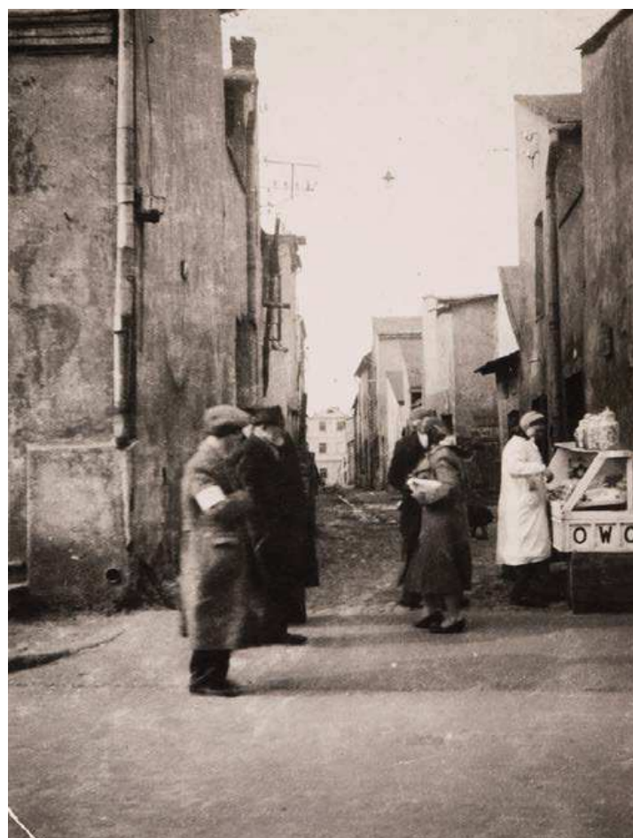
Zbiory ŻIH, sygn., J-93, „Esik”, „Okolice Starego Rynku”