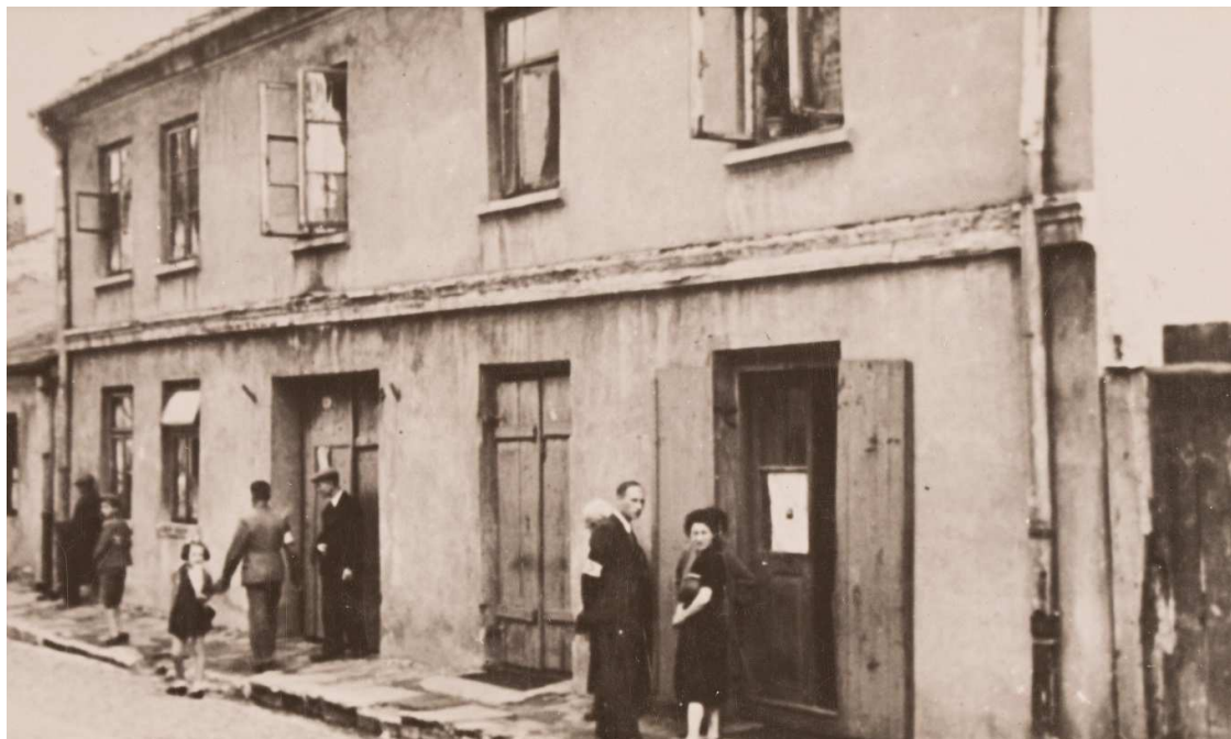
Zbiory ŻIH: sygn., II- 633, L. Kuszuir, „Żydzi przed swoimi biednymi sklepikami”