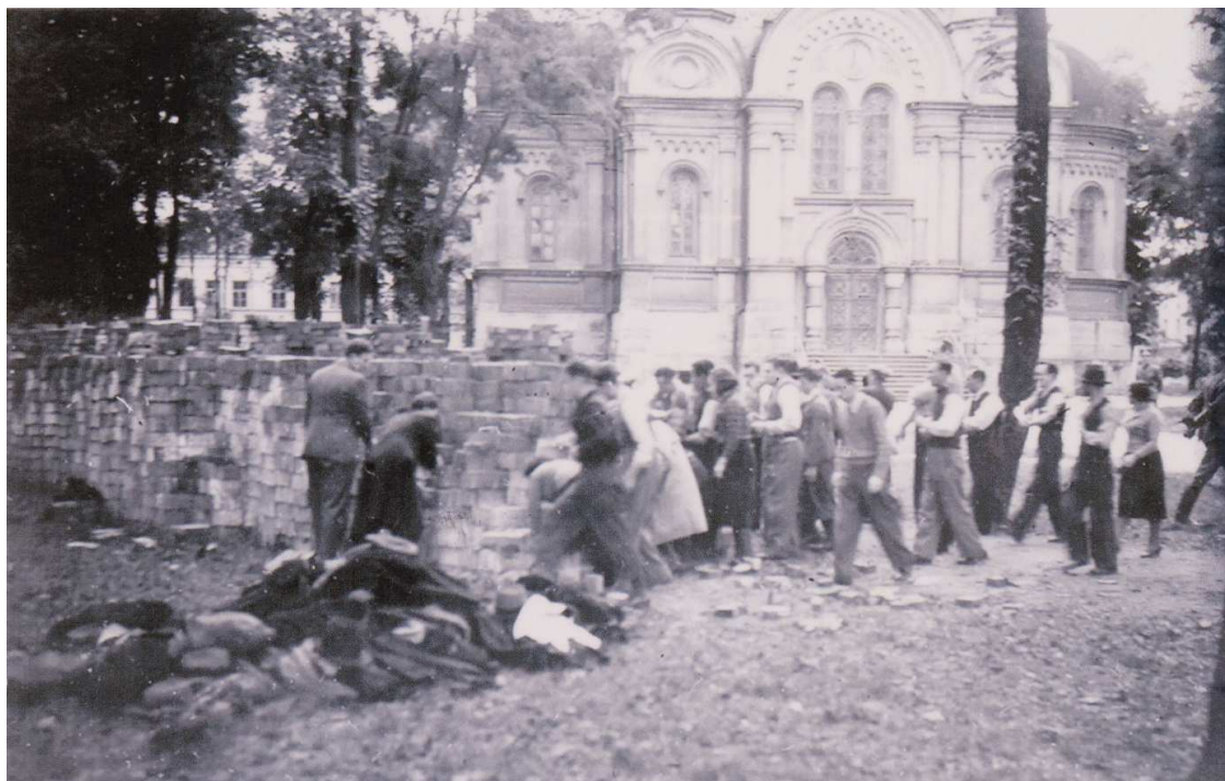
Zbiory ŻIH, sygn., czes021, autor nieznany „Okupacja, prace przymusowe”