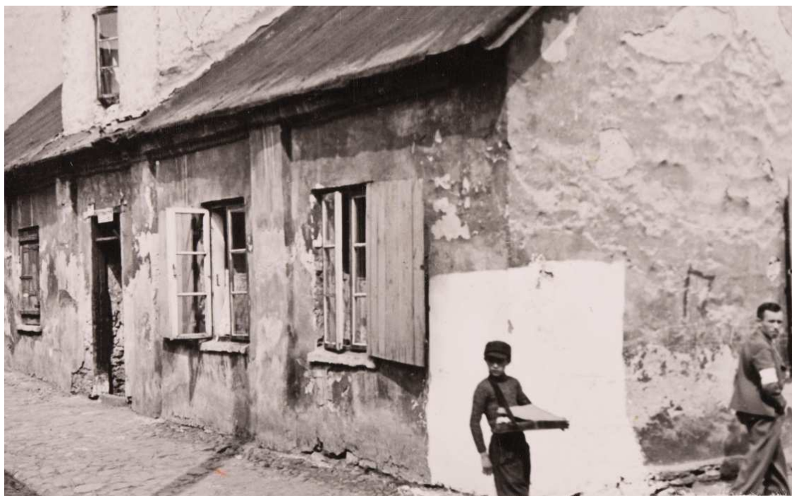
Zbiór ŻIH, sygn., 714, autor nieznany, „Chłopiec przy domu na ulicy Nadrzecznej 35”