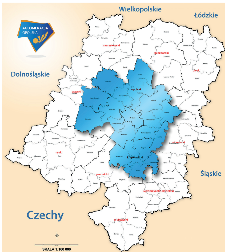
Rys. 1. Aglomeracja opolska