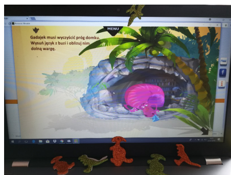
Fot. 2. Wykorzystanie komputera, materiały własne (Logopedyczna bajka terapeutyczna „Rromeek i Rradek – głoska r” – Wydawnictwo DoDo4Story)