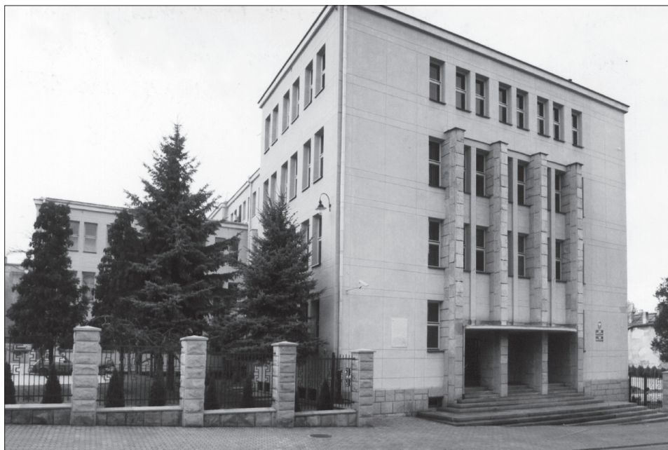
Fot. 1. Nowy gmach Sądu Okręgowego w Przemyślu przy ul. Konarskiego 6 (wygląd obecny) – od 1 grudnia 1938 r. siedziba przemyskiego Towarzystwa Prawniczego.