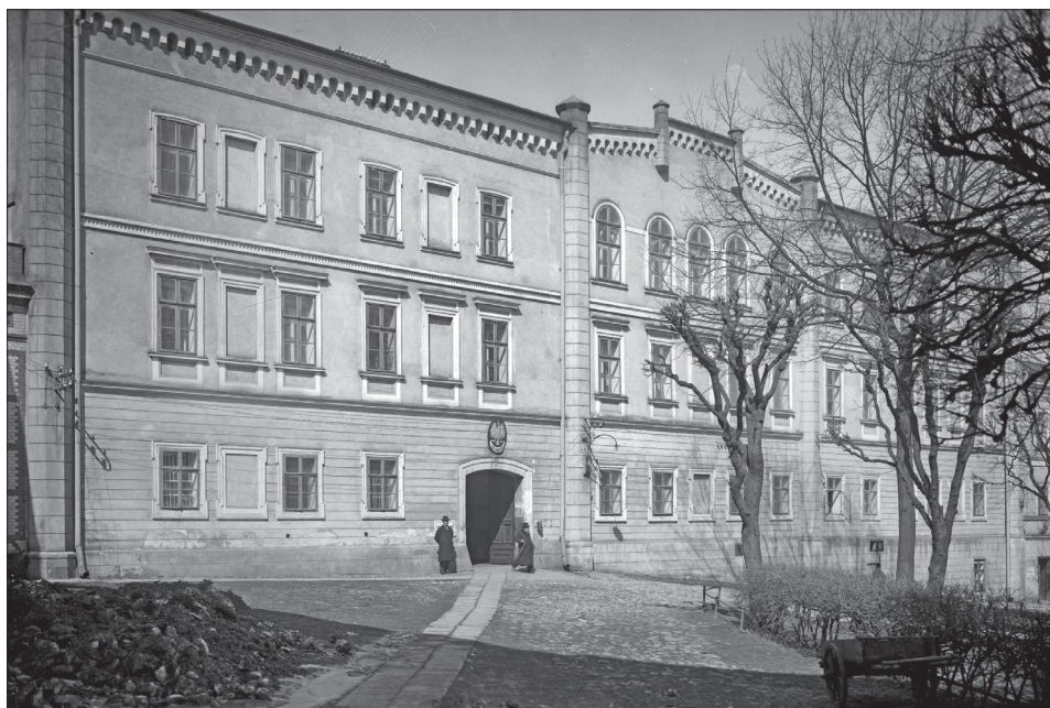
Fot. 2. Sąd Okręgowy (do 1914 r. Obwodowy) w Przemyślu, Rynek 26, gdzie odbywały się wykłady Towarzystwa Prawniczego do listopada 1938 r.