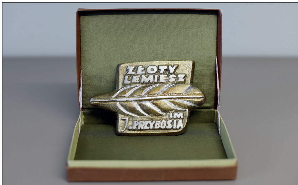
Fot. 2. Złoty Lemiesz – nagroda w Konkursie Poezji Współczesnej im. Juliana Przybosia „O Złoty Lemiesz” – 1971 r. (ze zbioru archiwum rodzinnego Przybosiów i Mikoszków; AP Rzeszów, fot. Maciej Zdun).