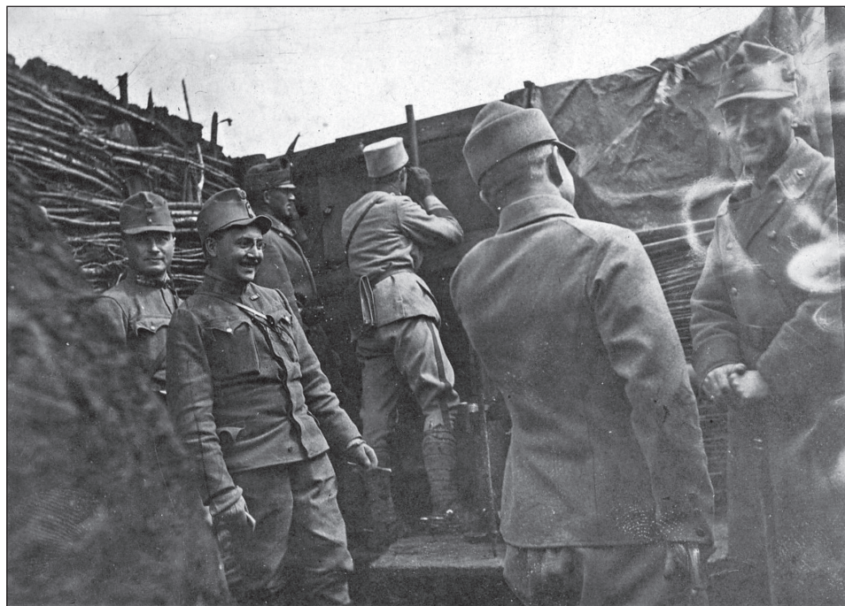
Fot. 6. Żołnierze austriaccy w okopach.