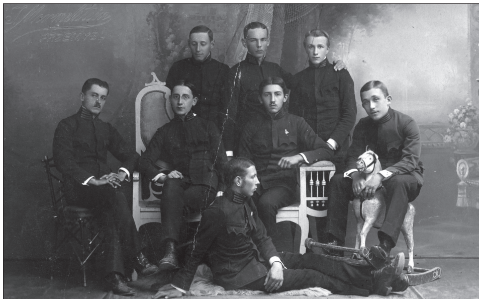
Fot. 10. Fotografia grupy młodych mężczyzn (maturzystów?) w mundurach gimnazjalnych (fotografia ze zbioru archiwum rodzinnego Przybosiów i Mikoszków; AP Rzeszów).