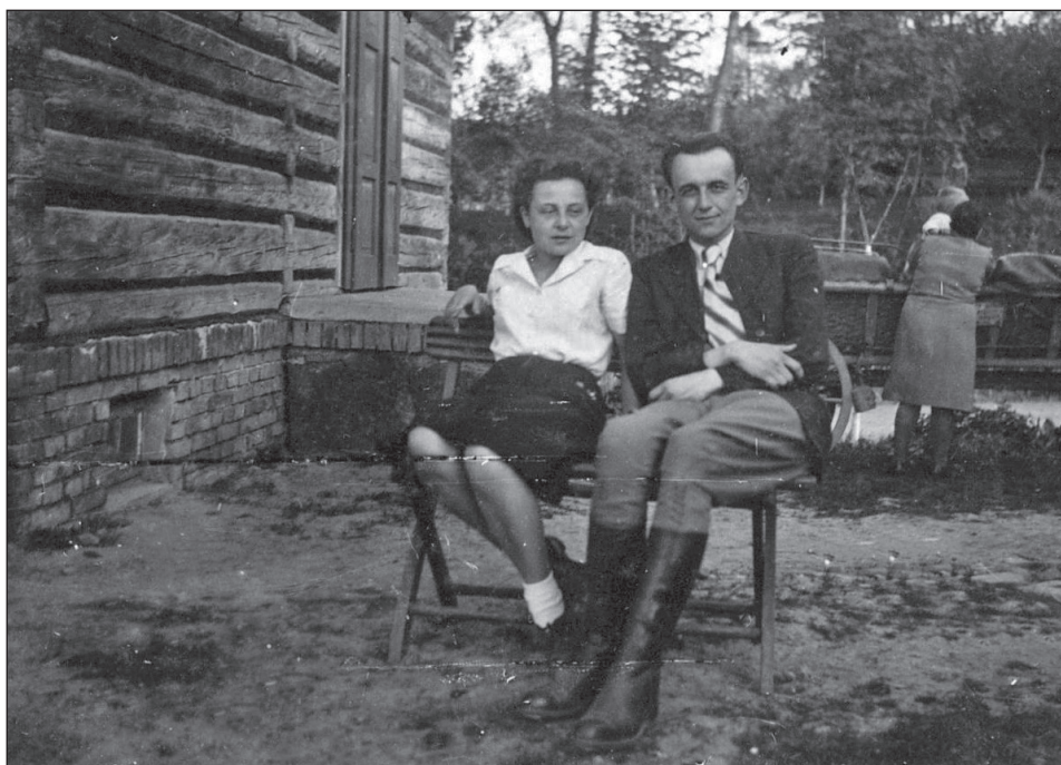
Fot. 8. Dwoje ludzi przed domem.