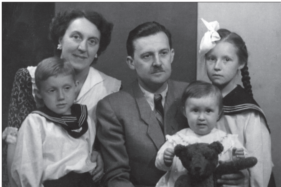
Fot. 9. Zdjęcie rodzinne, 1952 r..