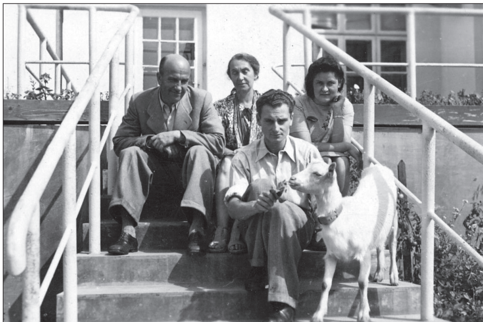
Fot. 11. Grupa osób z kozą na schodach przed domem (fotografia ze zbioru archiwum rodzinnego Przybosiów i Mikoszków; AP Rzeszów).