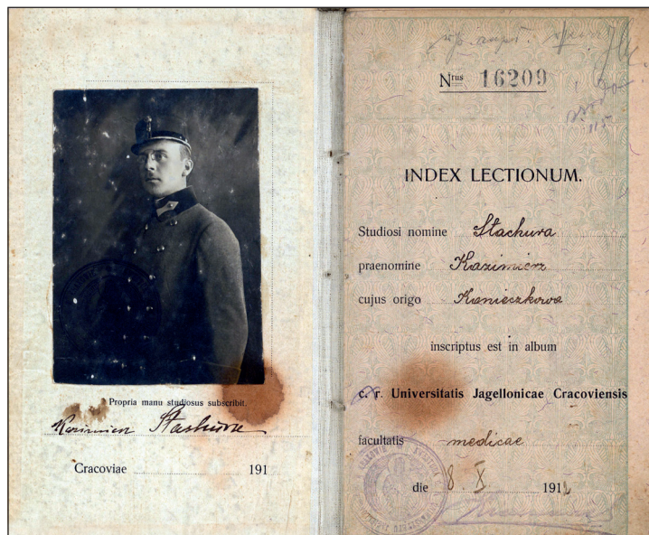
Fot. 5. Indeks studenta Uniwersytetu Jagiellońskiego w Krakowie Kazimierza Stachury z 1912 r. (dokument ze zbioru archiwum rodzinnego Przybosiów i Mikoszków; AP Rzeszów).