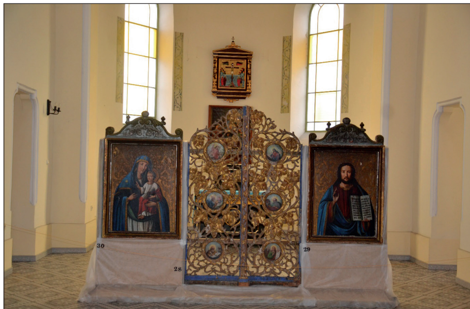
Carskie Wrota, Chrystus Nauczający i Bogurodzica z historycznej Eparchii Przemyskiej.