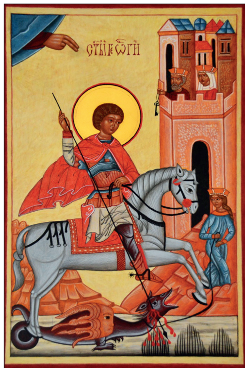
Święty Jerzy Męczennik „Zwycięzca”, XVI w., z cerkwi w Wełykiem. Miejsce ekspozycji: Muzeum Narodowe Ziemi Przemyskiej w Przemyślu.