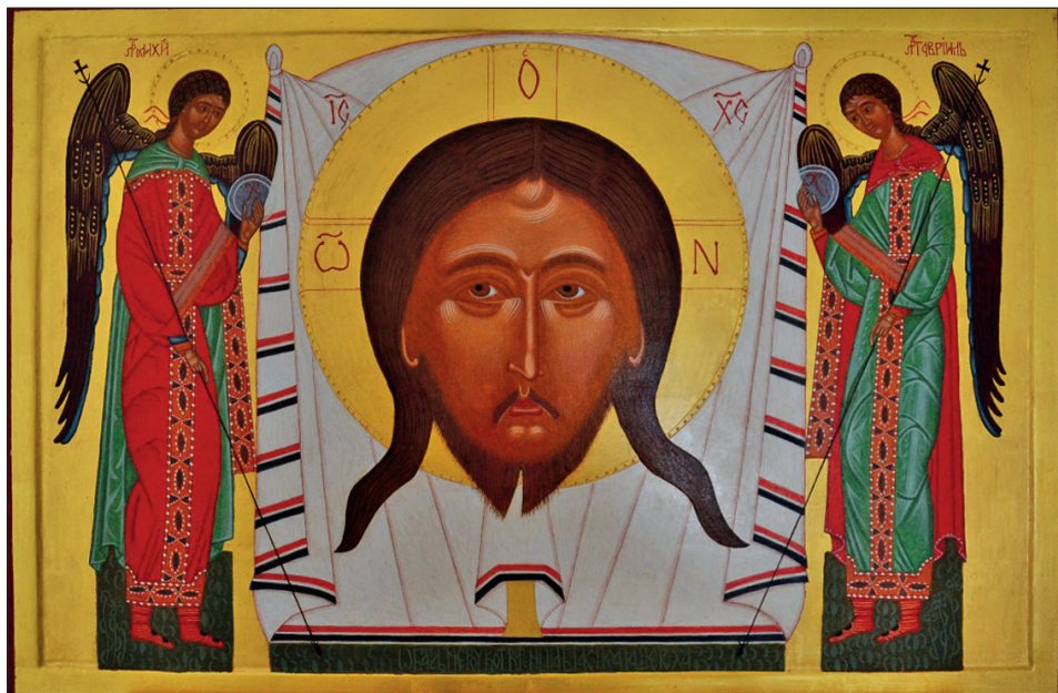
Mandylyon – Oblicze Chrystusa na chuście, XV w., z cerkwi we wsi Terło. Miejsce ekspozycji: Muzeum Narodowe im. Andrzeja Szeptyckiego we Lwowie.