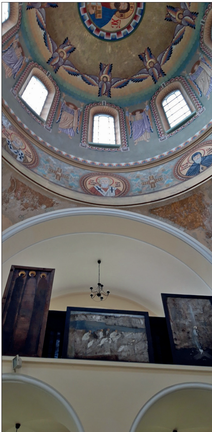
Malarstwo ściennie w tamburze i kopule kaplicy dawnego Seminarium Greckokatolickiego w Przemyślu.