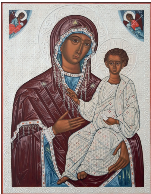
Hodegetria w otoczeniu archaniołów, XVI w., Krąg Mistrza ikonostasu cerkwi w Nakonecznem. Miejsce ekspozycji: Muzeum Narodowe w Krakowie.