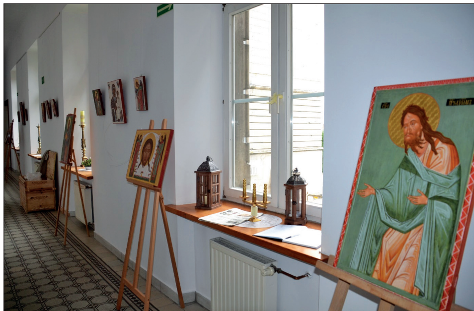
Fragment wystawy – na pierwszym planie Ikona św. Jana Chrzciciela z cerkwi w Drohobyczu. Miejsce ekspozycji: Zamek w Olesku, Ukraina.