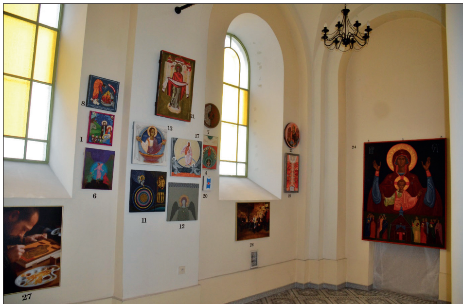
Prace poplenerowe z Nowicy na przemyskiej wystawie w 2021 r.