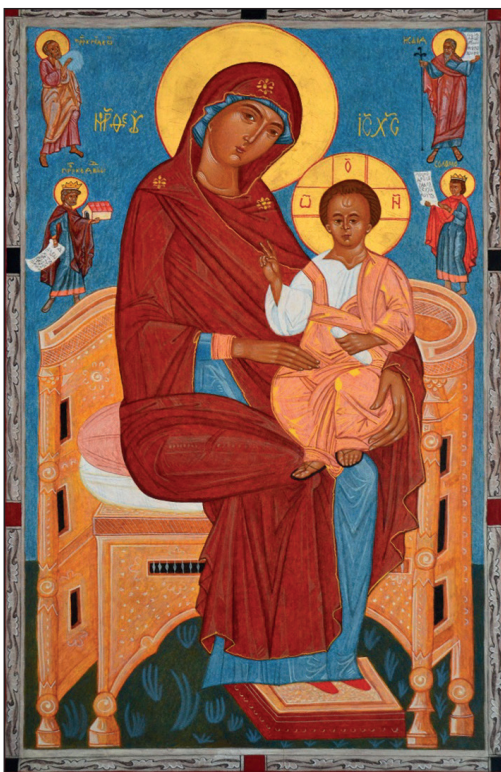
Hodegetria na tronie w otoczeniu proroków i królów starotestamentowych, XV-XVI w., z cerkwi w Krempnej. Miejsce ekspozycji: Muzeum Narodowe im. Andrzeja Szeptyckiego we Lwowie.