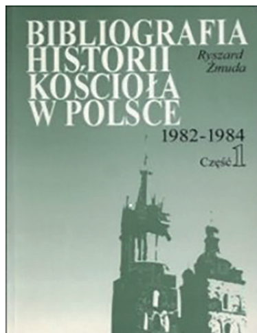
Il. 7. Okładka Bibliografii historii Kościoła w Polsce 1982-1984 , cz. 1, Warszawa 1997