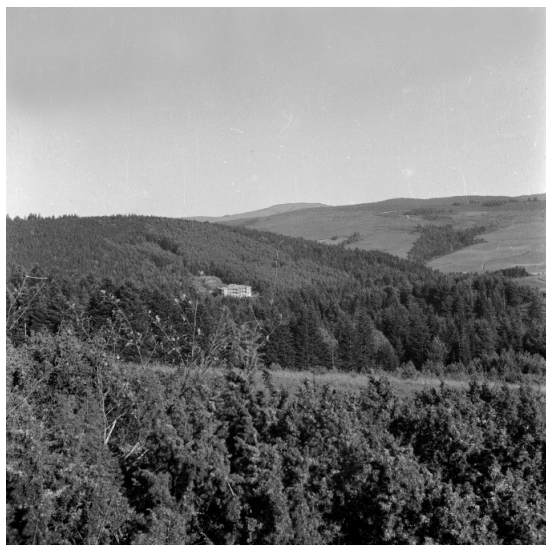
Il. 11. Dom sióstr nazaretanek na tle gór, Komańcza 1956.