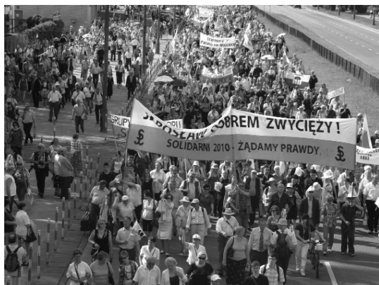
Il. 14. Procesja z relikwiami błogosławionego ks. Jerzego Popiełuszki idąca wzdłuż ulicy Powsińskiej. Widoczni uczestnicy procesji niosący flagi i transparenty o treści: „Jarosław dobrem zwycięży! Solidarni 2010”, „Sułów”, „Lecz duszy zabić nie można. Solidarność Siedlce”, „Starogard Gd. Parafia św. Wojciecha”, „Musimy się na nowo policzyć” „Ratuj Polskę. Limanowa”, „Głosuj na Jarka”, „Solidarność Siedlce”, Warszawa 6 czerwca 2010 r.