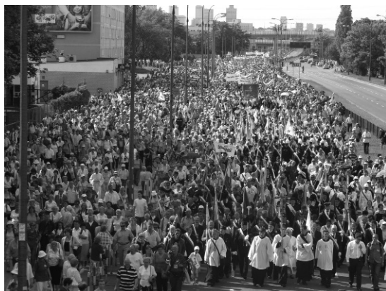
Il. 12. Procesja z relikwiami błogosławionego ks. Jerzego Popiełuszki idąca ulicą Powsińską. Na pierwszym planie widoczni księża i górnicy. W głębi widoczny obraz z wizerunkiem księdza Jerzego towarzyszący niesionym relikwiom, Warszawa 6 czerwca 2010 r.