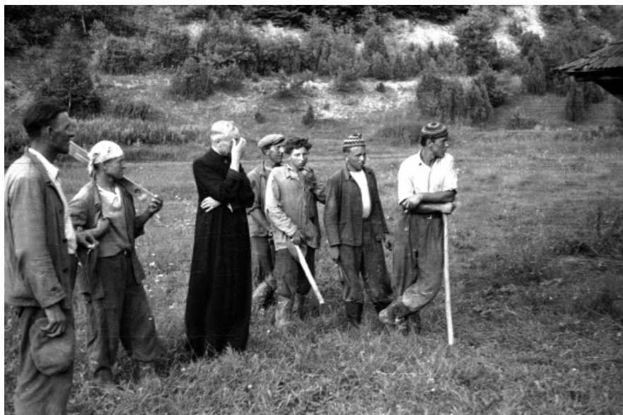
Il. 4. Wycieczka nad jezioro Duszatyń. Kard. Stefan Wyszyński rozmawia z robotnikami leśnymi, Duszatyń 1956.