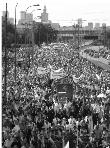
Il. 13. Procesja z relikwiami błogosławionego ks. Jerzego Popiełuszki idąca ulicą Powsińską. Uczestnicy procesji niosą sztandary, flagi narodowe oraz transparenty. Widoczny obraz z wizerunkiem księdza Jerzego towarzyszący relikwiom w szkatule niesionym przez diakonów. Przed relikwiami widoczni dostojnicy kościelni, Warszawa 6 czerwca 2010 r.