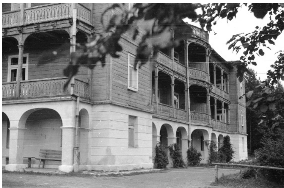
Il. 8. Fragment klasztoru sióstr Nazaretanek, Komańcza 1956.