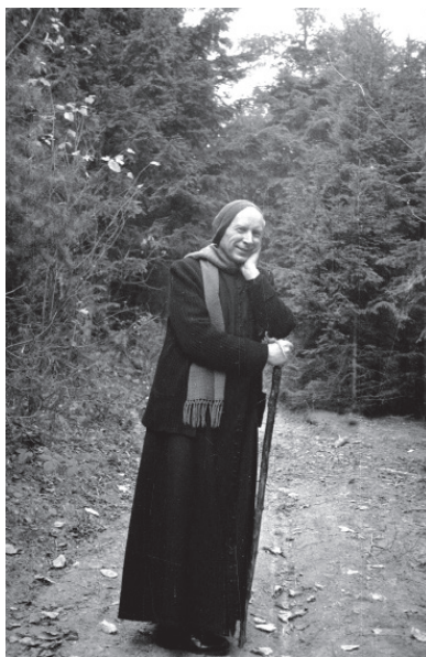
Il. 1. Kard. Stefan Wyszyński na spacerze, Komańcza 1956.