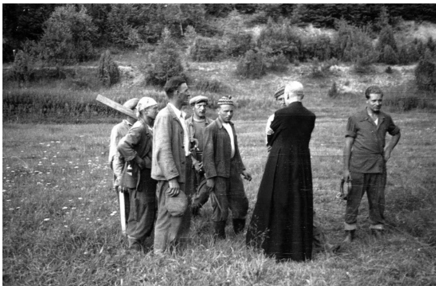
Il. 3. Wycieczka nad jezioro Duszatyń. Ksiądz kard. Stefan Wyszyński rozmawia z robotnikami leśnymi, Duszatyń 1956.