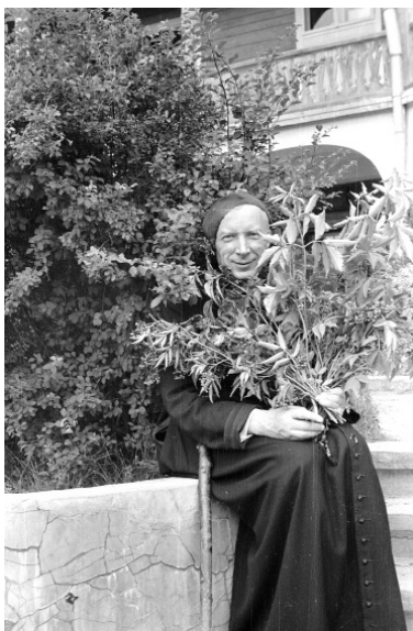
Il. 5. Kard. Stefan Wyszyński przed domem sióstr nazaretanek, Komańcza 1956.