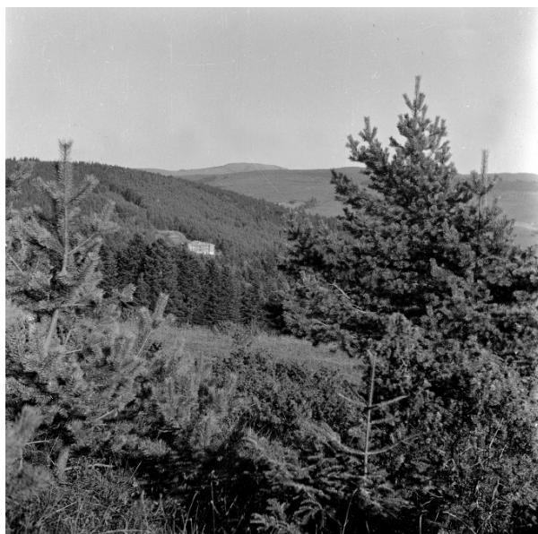
Il. 6. Dom sióstr nazaretanek na tle gór, Komańcza 1956.