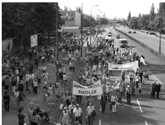
Il. 15. Opis obrazu: Procesja idąca wzdłuż ulicy Powsińskiej. Widoczni uczestnicy procesji niosący flagi i transparenty: „Przebrała się miarka, głosując na Jarka”, „Solidarność Siedlce. Polimex Mostostal”, „Solidarność Mazowsze”, „Zło dobrem zwyciężaj. Solidarność Golub Dobrzyń”, „Akcja katolicka w Knurowie”, Warszawa 6 czerwca 2010 r. Fot. Nikodem Bończa-Tomaszewski

Źródło: Narodowe Archiwum Cyfrowe, Procesyjne przeniesienie relikwii błogosławionego ks. Jerzego Popiełuszki z pl. J. Piłsudskiego do Świątyni Opatrzności Bożej w Warszawie – procesja przechodząca przez ul. Powsińską róg ul. B. Limanowskiego przy kładce dla pieszych, sygn. 3/76/0/0/1/39