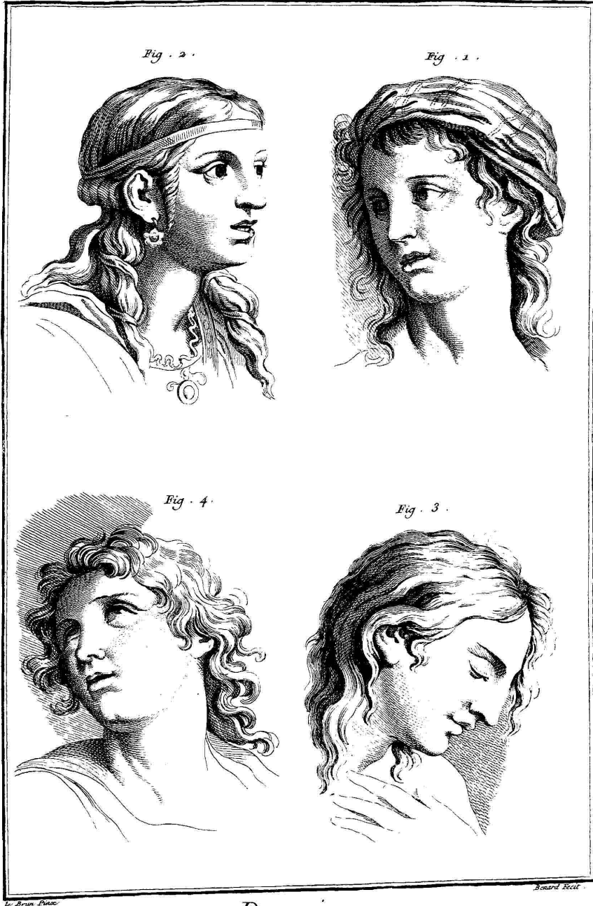
Dessain, Expression des Passions.