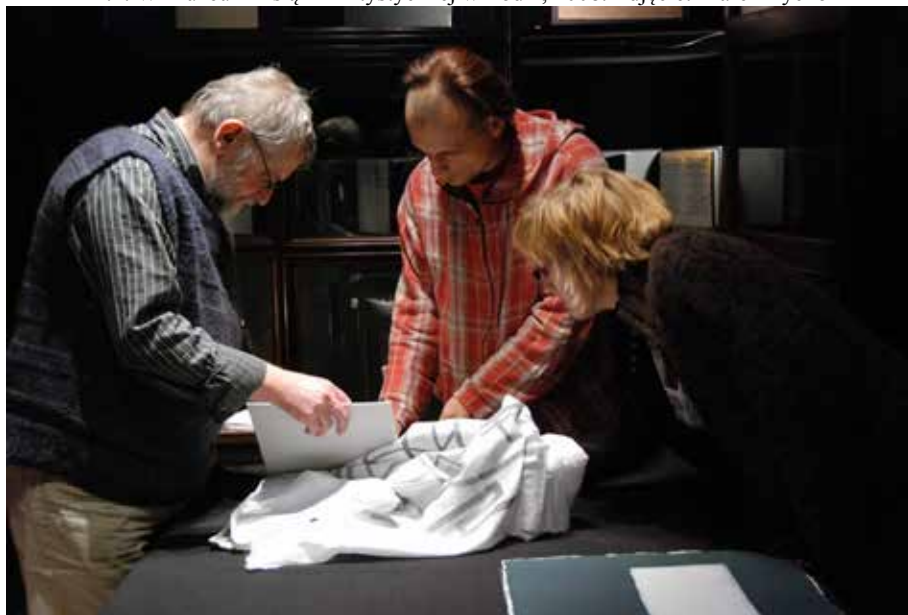
Il.4. W Muzeum Książki Artystycznej w Łodzi, 2008.

Kolejnym ważnym aspektem rzetelnego podejścia do pracy jest konieczność zdobycia przez typografa interdyscyplinarnej wiedzy. Projektant książki nie może ograniczyć się tylko do opanowania umiejętności z zakresu estetyki projektowania. Powinien mieć świadomość „uwarunkowań technicznych nowoczesnej poligrafii, psychologicznego oddziaływania form graficznych,