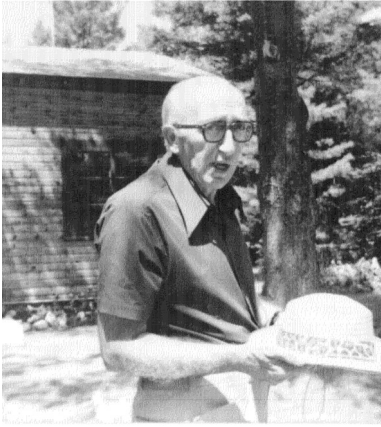
W ukochanym Rowdon