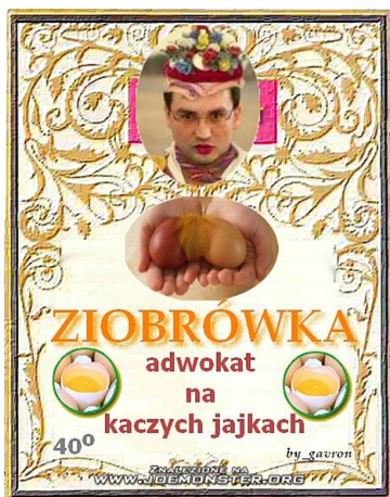
Parodia etykiety butelki z alkoholem Ziobrowka, https://joemonster.org/mg/show/28742