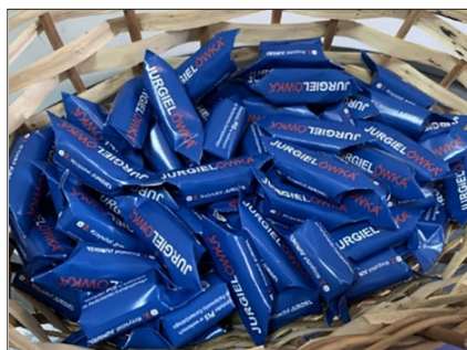
Cukierki o nazwie Jurgielówka, https://podlaskie24.pl/artykul/polityka/krzysztof-jurgiel