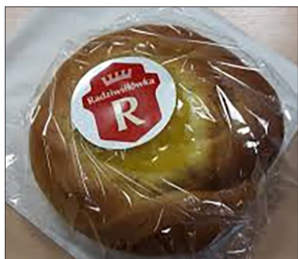
Drożdżówka Radziwiłłówka

mie pocztówki promująca Janusza Korwin-Mikkego, lub pełnią funkcję oficjalnych tytułów. Do tej drugiej grupy można zaliczyć takie nazwy, jak: Ratajówka 'oficjalny tytuł gazetki wydawanej w Gimnazjum im. Macieja Rataja w Żmigrodzie' oraz Korfantówka , która odnosi się do dwóch desygnatów: 'jednodniówki śląskiej wydanej z okazji Roku Wojciecha Korfantego' 61 i 'czasopisma Instytutu Myśli Polskiej im. Wojciecha Korfantego' (pierwszy numer ukazał się w sierpniu 2020 r.) 62 .