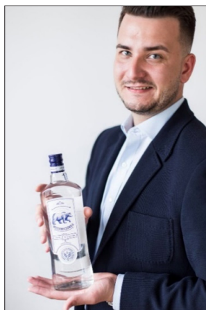
Butelka alkoholu Misiewiczówka, https://winicyjatywa.pl/wodka-misiewiczowka/#