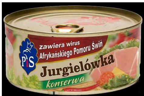
Konserwa Jurgielówka, https://www.audiostereo.pl/topic/2055-brak-humoru-na-forum/page/788/