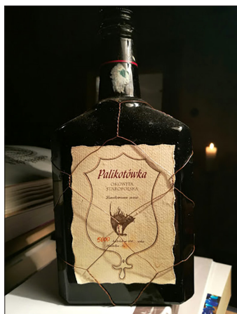
Butelka alkoholu Palikotówka, http://palikot.pl/wosp-palikotowka/