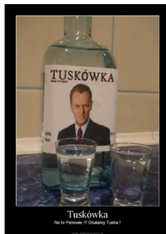
Mem zawierający derywat Tuskówka, https://demotywatory.pl/2853736/Tuskowka

wyrazów, z których wyłania się jednoznacznie negatywny obraz rządów Donalda Tuska, co potwierdzają teksty werbalne, na przykład „przypis [sic!] na wódkę tuskówkę. Zakorkować pustą butelkę” 57 , a także komunikaty multimodalne. Do omawianego pola semantycznego należą też okazjonalizmy: balcerowiczówka , rostówka , lepperówka , korwinówka oraz dornówka , motywowane nazwiskami następujących polityków: