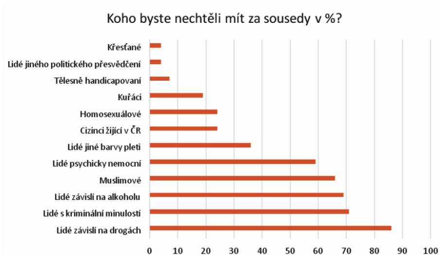
Graf 1 Koho byste nechtěli mít za sousedy – občané ČR