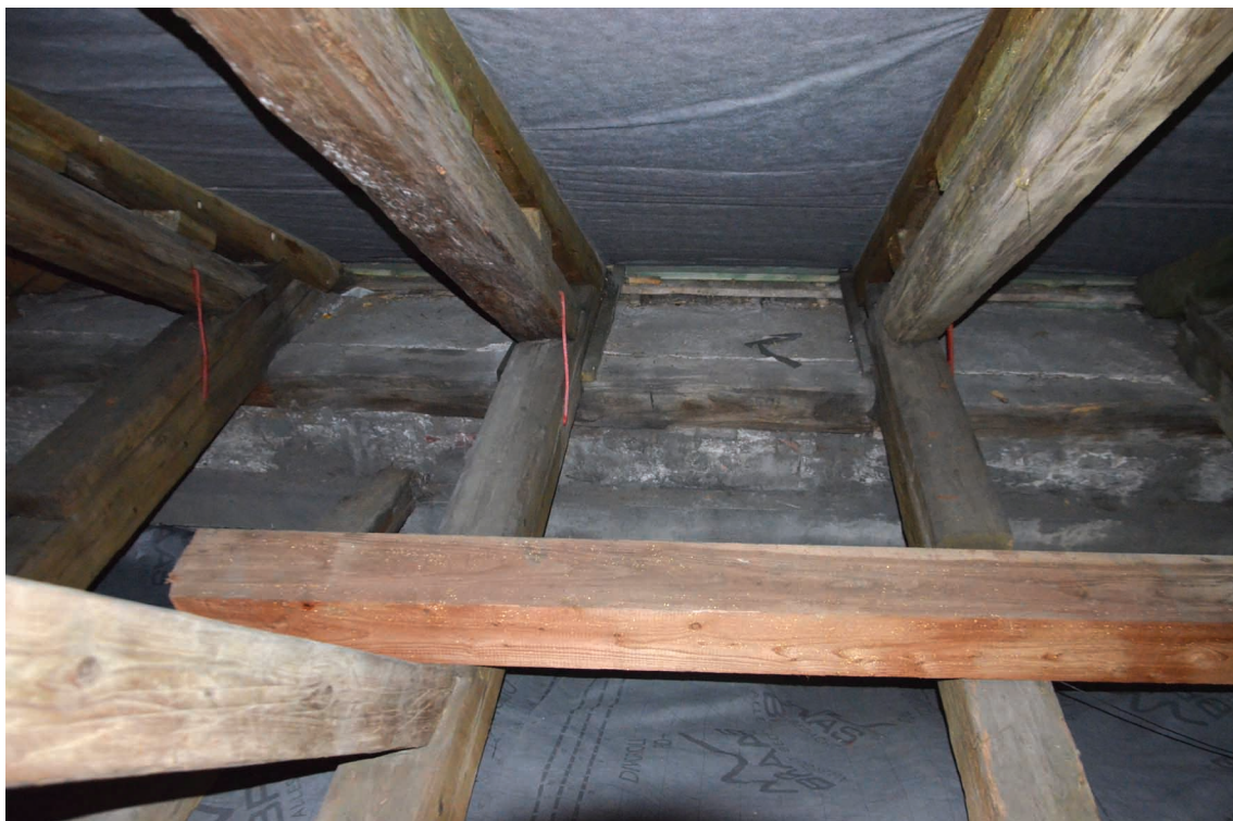
5. Bochnia, kościół św. Mikołaja, strych nad nawą północną.