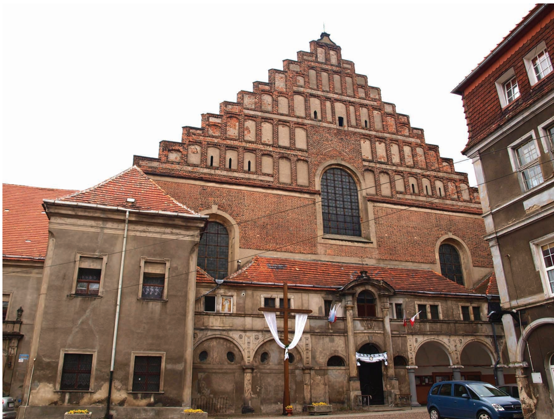
15. Żagań, kościół augustianów, fasada zachodnia.

Kutznera 126 , dostrzegającego oddziaływania brandenbursko-marchijskie. Ponadto w pole szczytu została tam nietypowo włączona część okna nawy głównej. Kompozycja ta bardzo przypomina fasadę w Bochni, być może jednak podobieństwo to wynika nie tyle z bezpośredniej inspiracji, ile po prostu z rozwiązania podobnego problemu architektonicznego, którym w obu przypadkach były pseudobazyliki o dość przysadzistych proporcjach. Sama hipoteza o wpływach saskich, ewentualnie zapośredniczonych przez Śląsk, jest jednak prawdopodobna, znane są bowiem oddziaływania tego obszaru na małopolską architekturę przełomu XV i XVI w. Dowodem na to jest przede wszystkim gmach Collegium Maius Uniwersytetu Jagiellońskiego z wywodzącymi się z Miśni sklepieniami kryształowymi (po 1493 127 ) i oknami o łukach kotarowych. Te pierwsze pojawiły się ponadto w tym czasie także w kaplicy przy południowej wieży kościoła św. Małgorzaty w Nowym Sączu 128 .