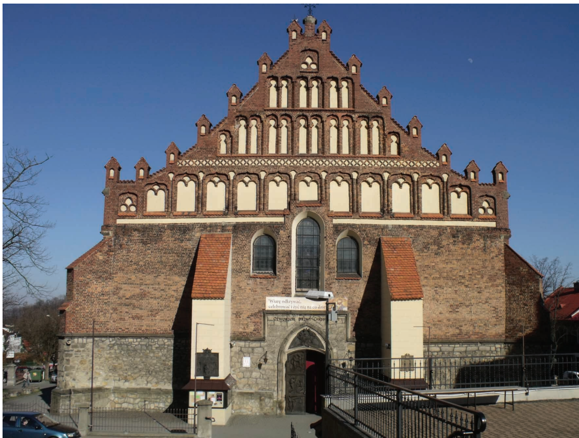
1. Bochnia, kościół św. Mikołaja, widok od zachodu.

obejmujących odkrywki struktury murów i podpór we wnętrzu, dziś całkowicie przekształconym i otynkowanym, które być może pozwolą w przyszłości doprecyzować część zaproponowanych przeze mnie tez.