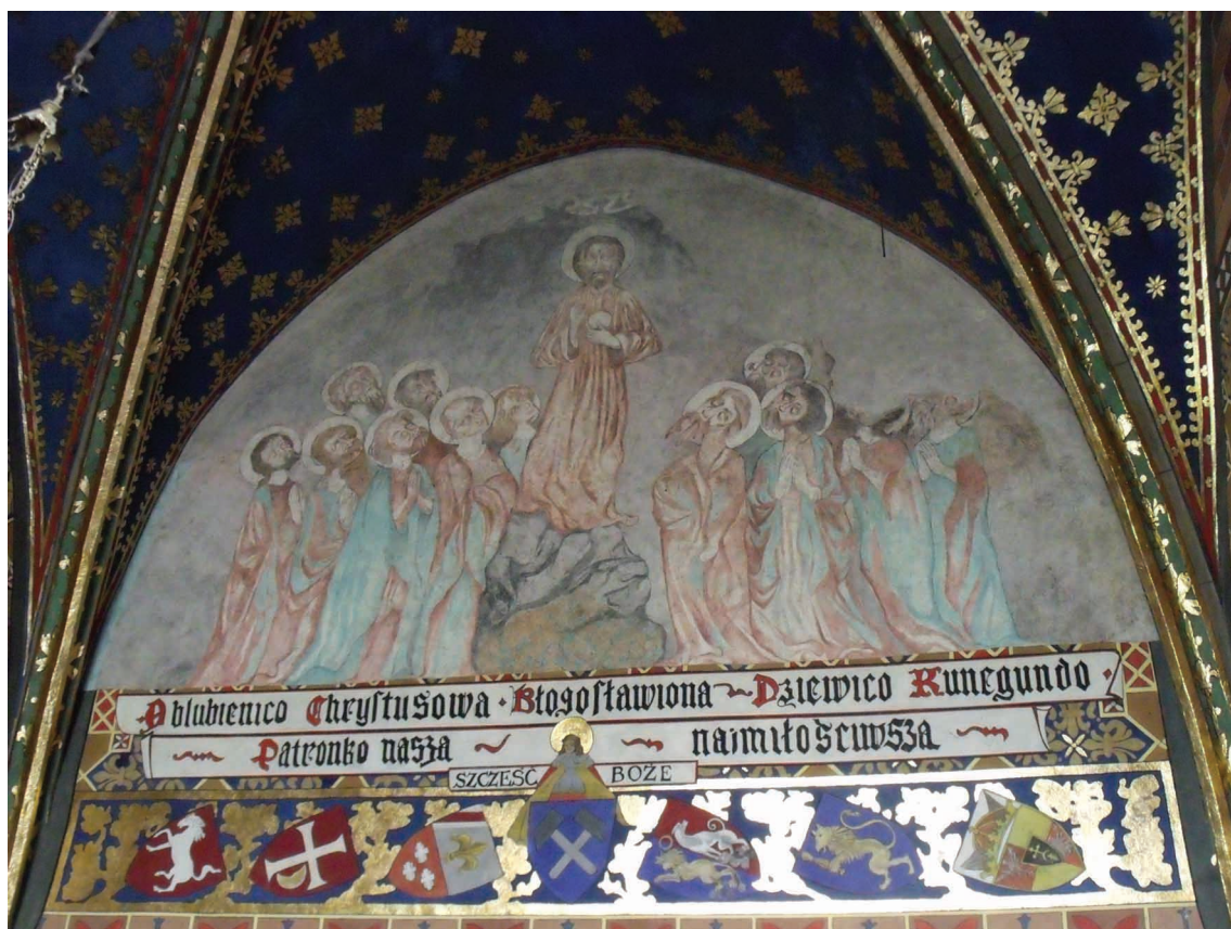
4. Bochnia, kościół św. Mikołaja, gotyckie malowidło w kaplicy św. Kingi.

szo fundamente, wykonano stalowe ściągi poniżej posadzki i ponad sklepieniami, a same sklepienia częściowo przemurowano 54 . Dodatkowo wykonano nową przyporę dla podparcia kaplicy Matki Boskiej, wymieniono tynki, zrekonstruowano gzyms wieńczący w prezbiterium i częściowo wyremontowano dach. We wnętrzach wymieniono posadzkę w kaplicy Matki Boskiej, wybudowano nowy chórek muzyczny w nawie głównej, a w latach 1965–1970 wykonano nową polichromię, zachowując i konserwując starą w kaplicy św. Kingi. W 1966 r. odkryto gotyckie malowidło przedstawiające Rozesłanie Apostołów 55 . Kolejną konserwację tej kaplicy przeprowadzono w roku 2000. Odtworzono wówczas wspomniane malowidło, wcześniej bardzo zniszczone 56 . Ostatnie remonty przeprowadzone zostały w latach 2008–2009 (wymiana więźby dachowej i dachówki), oraz w 2014 r. (położenie marmurowej posadzki w korpusie nawowym kościoła) 57 , a od 2018 r. stopniowo są remontowane elewacje zewnętrzne.