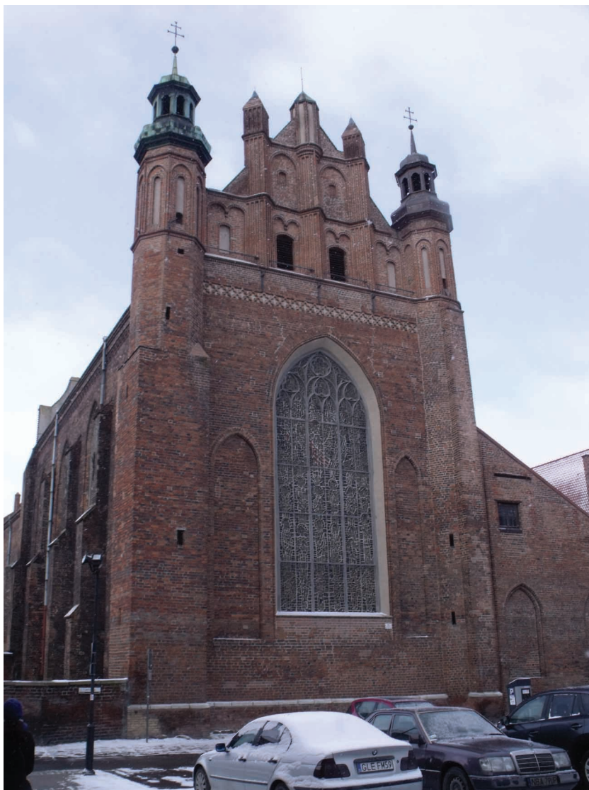
11. Gdańsk, kościół karmelitów (obecnie oblatów), szczyt wschodni.

kościółów na prowincji, np. kolegiat w Sandomierzu (połowa XIV w. 86 ) i Bodzentynie (ok. połowy XV w. 87 ). Planem takim cechuje się także omawiany przez Włodarka kościół benedyktynów w Tyńcu, który jednak, jak wykazał badacz, ma czeską genezę 88 . Małopolskie i Śląskie realizacje oddziaływały także dalej na wschód, gdzie ich wypadkową stanowi katedra łacińska we Lwowie (lata 60. XIV – koniec XV w. 89 ).