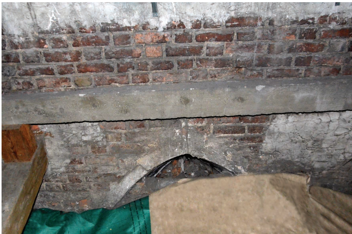
7. Bochnia, kościół św. Mikołaja, strych nad kaplicą Mariacką, relikwiarz okna w prezbiterium.

nim ugaszenie przez nią pożaru żupy bocheńskiej na tle panoramy miasta wraz z kościołem. Kolejne widoki Bochni pochodzą już z XIX w. i są to drzeworyt z 1838 59 oraz litografia Carla Bernda z 1846 r. 60 Nieco późniejsze są pierwsze przedstawienia samej fary – rycina z połowy XIX w. 61 , akwarela datowana na 2. połowę XIX stulecia 62 i dość szkicowy rysunek Jana Matejki 63 . Wszystkie one są jednak na tyle schematyczne, że praktycznie uniemożliwiają wyciągnięcie jakichkolwiek szczegółowych wniosków. Wyjątek stanowi jedynie zdjęcie wykonane przez Demetrykiewicza 64 (il. 2), na którym wyraźnie widoczny jest fragment fasady zachodniej (w dalszej części pracy posłuży ono do rekonstrukcji pierwotnego wyglądu szczytu).