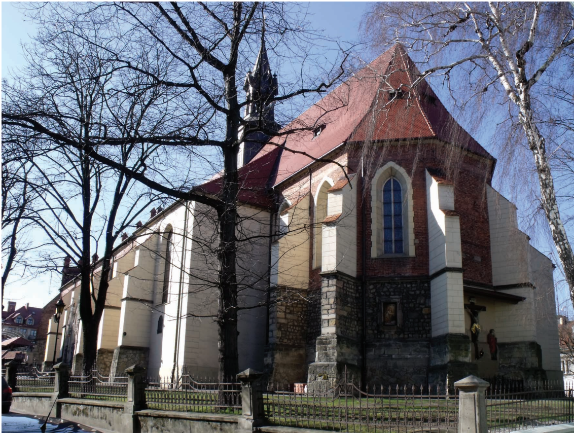
3. Bochnia, kościół św. Mikołaja, widok od strony południowo-wschodniej.

było najprawdopodobniej krzyżowe 18 . Sam Wójtowicz pierwotne podpory określił jednak jako sześciokątne 19 . Tezę o ośmiobocznych filarach i sklepieniu krzyżowym powtórzyli natomiast Wyczęsany 20 i Flasza 21 .