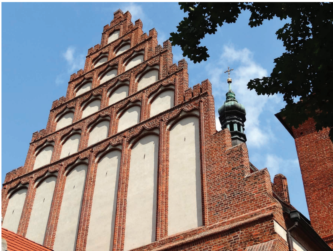
16. Bydgoszcz, fara (obecnie katedra), szczyt zachodni.

przez gdańskiego architekta; il. 16 129 ), a także w powstałych pod jej wpływem rozwiązaniach w Wielkopolsce, m.in. w psalterii w Poznaniu (ok. 1512 130 ) czy kościołach w Kole (kaplica NMP, 1522 131 ) i Gostyniu (kruchta, 1523 132 ). Szczyty te tworzą jednak dość jednolitą grupę, o niewystępujących w Bochni elementach: wszystkie są schodkowe, mają sterczyny grupowane w charakterystyczny sposób po dwie lub trzy obok siebie i wymijające się osie blend w każdym z poziomów, dlatego też nie wydaje mi się, by mogły stanowić wzór dla omawianej tu budowli.