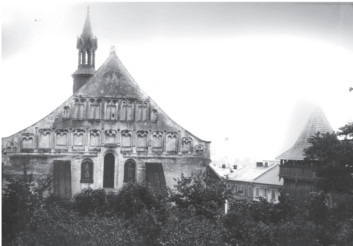
2. Bochnia, kościół św. Mikołaja, widok od zachodu. Zdjęcie archiwalne. neg. nr 19936.

oni jednak, że kościół został następnie w XV w. przebudowany, a szczyt pochodzi dopiero z przełomu wieku XV i XVI 11 . Krasnowolski w kolejnych publikacjach uściślił te ustalenia, podając, że zapewne w połowie wieku XIV został ukształtowany plan i program kościoła, a obecna bryła pochodzi dopiero z okresu po pożarze w 1447 r. 12 Zbliżone datowanie przyjęli także Jerzy Wyczesany 13 i Jan Flasza 14 . Ostrożniejsi byli natomiast autorzy hasła w katalogu Architektura gotycka w Polsce , którzy bocheńską farę określili ogólnie jako pochodzącą z wieku XIV i XV, koniec prac datując na 1440 r. 15 Teofil Wojciechowski zadatował kościół na 1. połowę XV w., zaznaczając, że ostateczny kształt uzyskał on dopiero po pożarze w roku 1485 16 .