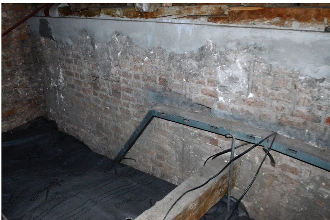
6. Bochnia, kościół św. Mikołaja, strych nad nawą południową, fragment muru ponad arkadowaniem międzynawowym.