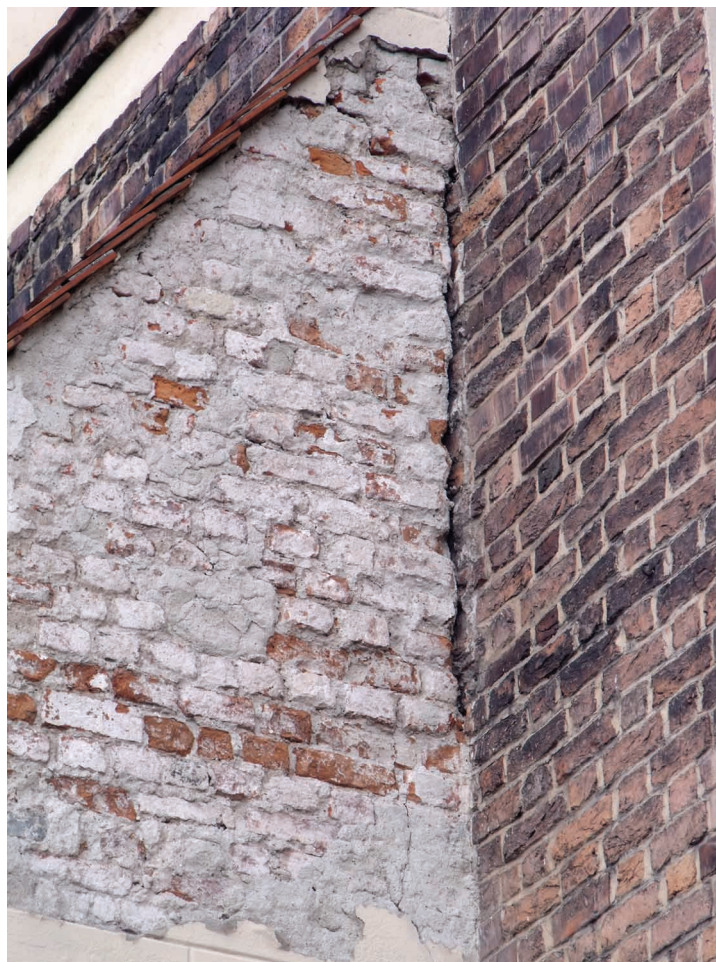
8. Bochnia, kościół św. Mikołaja, fasada, ubytki w tynku w przyporze poprzecznej.

się natomiast relikw górnej części okna (il. 7). Pierwotnie zapewne wychodziło ono na zewnątrz, obecnie znajduje się pomiędzy chórem a kaplicą Mariacką. Ze względu na fakt, że wysokość tej kaplicy jest równa wysokości naw bocznych kościoła, a w konsekwencji jest ona niższa niż prezbiterium, także i wspomniane okno jest obecnie nieco niższe niż pierwotnie, a jego najwyższa część została zamurowana, czego efektem jest znajdujący się na strychu relikw. Spostrzeżenia te każą domniemywać, że pierwotne sklepienie chóru, a zapewne także i naw, znajdowało się na tej samej wysokości co obecnie lub ewentualnie nieznacznie wyżej. Nie można natomiast niczego pewnego stwierdzić o jego formie. Jednakże biorąc pod uwagę fakt, że zgodnie z średniowieczną praktyką budowlaną sklepienia powstały zapewne po wykonaniu więźby dachowej i szczytu, to (jeśli przyjąć datowanie szczytu na przełom wieku XV i XVI lub 1. ćwierć XVI w.) można przypuszczać, że miały bogate układy kompozycyjne 65 .