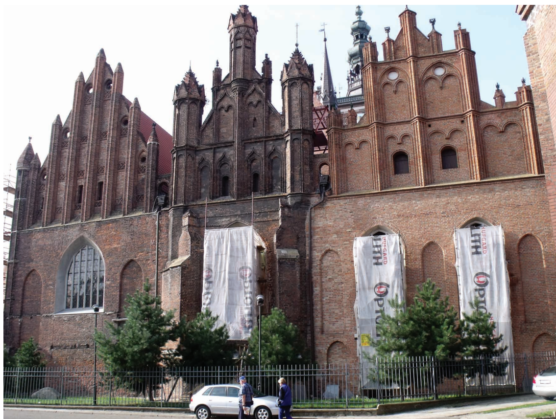
12. Gdańsk, kościół św. Katarzyny, widok od wschodu.

Szczególny wzór dla Bochni mógł stanowić zwłaszcza kościół Mariacki w Krakowie (prezbiterium przed 1360–1365 90 , korpus 1360/1365–1399 91 ). Rzuty poziome obu świątyń są niemal identyczne 92 (il. 10), a jednocześnie trudno wyobrazić sobie lepszy model dla fary bogatego miasta górniczego niż nowa fara stolicy. Trzeba jednak podkreślić, że mogła być to co najwyżej ogólna inspiracja, a nie intencjonalne kopiowanie, tym bardziej że proporcje obu kościołów znacząco się od siebie różnią. Jak dowodzą liczne przytoczone wcześniej przykłady, omawiana budowla wpisuje się raczej w szeroki nurt rozwojowy środkowoeuropejskich kościołów parafialnych.