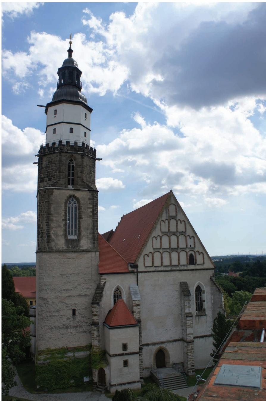
14. Kamenz, kościół Mariacki, widok od zachodu.