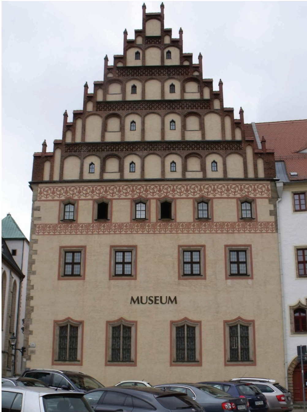
13. Freiberg, Thümeri.

samym mieście (ok. 1500 118 ) czy farze w Kamenz (szczyt wschodni, koniec XV w. 119 ). Zdarzało się jednak także stosowanie podwójnego łuku pełnego, np. w farach w Hoyer-swerdzie (ok. 1500 120 ) czy w Kamenz (szczyt zachodni, koniec XV w.; il. 14 121 ), a także w ośli grzbiet, np. w zamku biskupim w Wurzen (1491–1497 122 ) czy kościele Mariackim