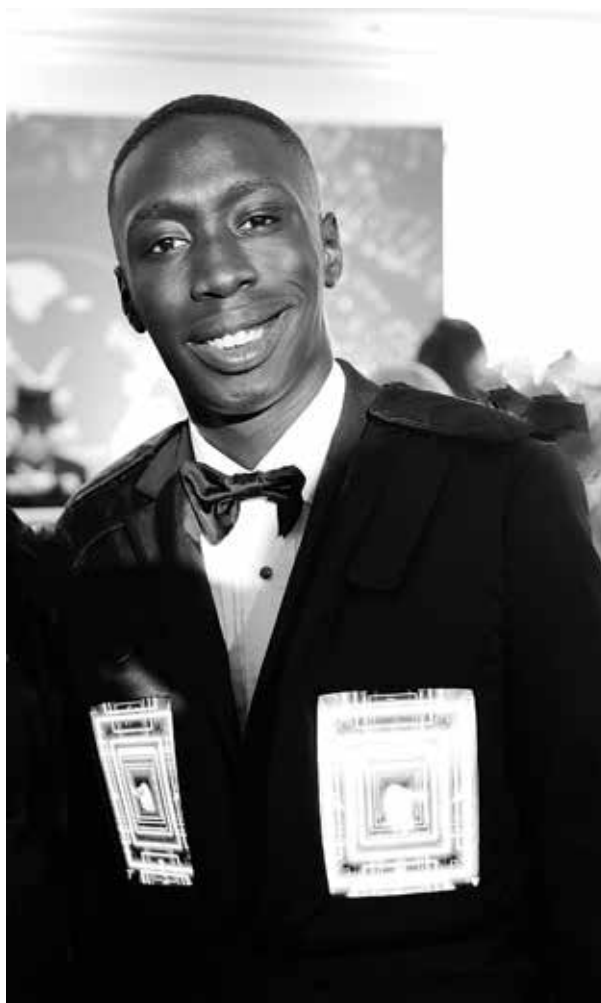
Khaby Lame, tiktoker, za: Wikipedia Commons.

Umberto Eco pod pseudonimem „Dedalus” publikuje książkę dla dzieci Ammazza l'uccellino , w zamyśle autora będącą erudycyjną parodią moralizatorstwa znanego ze szkolnych lektur. Tekst jest zapewne następstwem innego przedsięwzięcia, w które Eco angażuje się w tym samym