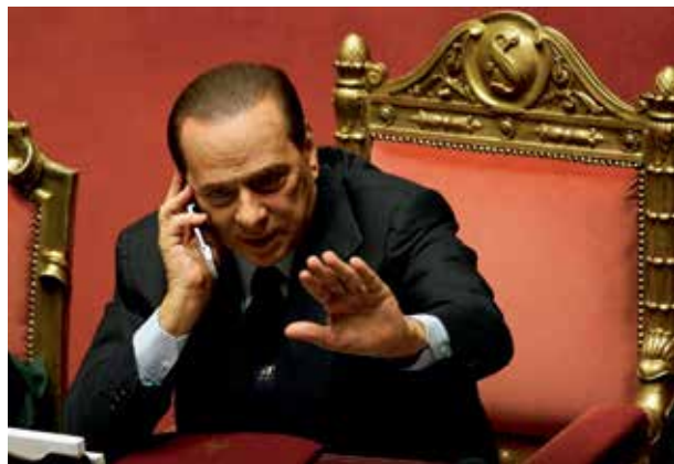
Silvio Berlusconi.

mane, czyli, z perspektywy Sycylijczyka, na dalekiej, wykształconej Północy. Sycylia natomiast posiada Grotta dell'Addaura z naskalnym graffiti, które zostało okrzyknięte najstarszą europejską sztuką homoerotyczną. Sztuka jaskiniowa jawi się jako przykład symbolizmu obrazowego, czyli myślenia prelogicznego. Jak pisałem już gdzie indziej,