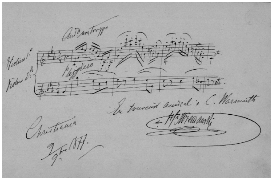
Il. 2. Autograf Henryka Wieniawskiego z zasobów cyfrowych Nasjonalbiblioteket w Oslo.