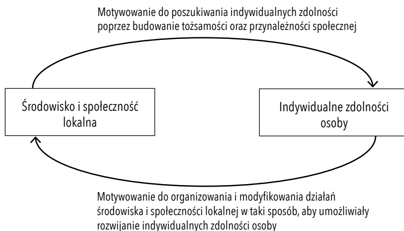
Schemat 2. Funkcja motywacyjna w relacji zdolności–środowisko i społeczność lokalna

działania, pozwalających tę wyjątkowość rozwijać. Stąd funkcja motywacyjna społeczności lokalnej wobec zdolności będzie miała charakter dwukierunkowy. Zależność przedstawiono na schemacie 2.