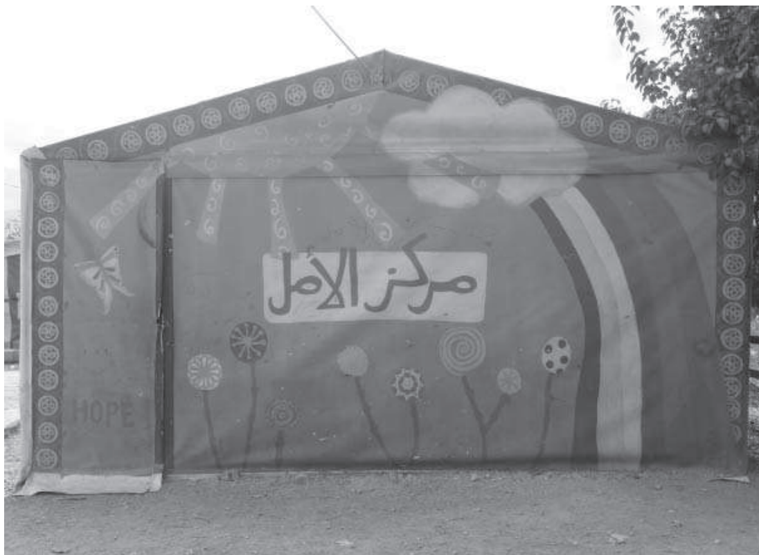
Ryc. 1. Zdjęcie wykonane przez Autorkę w miejscowości Zahle. Szkoła Al Amal .

W czasie wykonywania prac uczniowie byli skoncentrowani, uśmiechnięci, pogodni i zainteresowani tematem. Ponieważ rysownie odbywało się w czasie lekcji wśród znanych im osób: nauczycielek oraz kolegów i koleżanek, dzieci miały poczucie bezpieczeństwa i komfortu psychicznego. Moja obecność nie stanowiła dla nich bariery, ponieważ codziennie przychodziłam do szkoły, spędzałam z nimi czas i miałam z nimi bardzo dobry kontakt emocjonalny. Nie zauważyłam u nich momentów zahamowania i oporu przed rysowaniem. Oprócz ołówka i kredek, używały gumki i linijki. Z przeprowadzonych z nimi wywiadów dowiedziałam się, że ta forma pracy była dla nich atrakcyjna, ponieważ do tej pory nie miały możliwości wyrażania siebie za pomocą rysunku (Stradomska, 2018, s. 91-92).