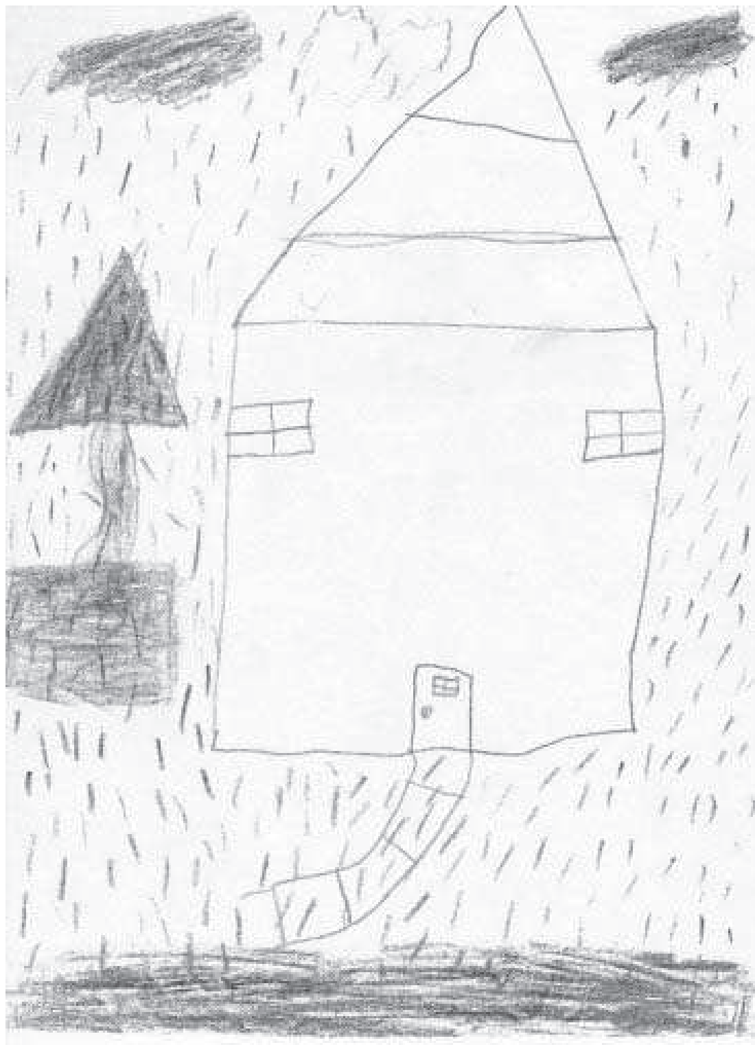
Ryc. 4. Rysunek wykonany przez 13-letniego chłopca

Obok rośnie drzewo, a na niebie, z dwóch dużych chmur pada rzęsy deszcz, który przed domem tworzy dużą kałużę. Całość sprawia smutne wrażenie.