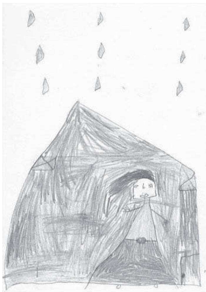
Ryc. 6. Rysunek wykonany przez 10-letnią dziewczynkę

Kolejny rysunek jest również wymowny. Został wykonany przez 8-letnią dziewczynkę, która stwierdziła w wywiadzie, że narysowała swoją sześciuosobową rodzinę mieszkającą w jednym małym pokoju. Największa, choć częściowo wytarta gumką, jest postać matki, która wskazuje ręką na autorkę rysunku. Obok niej stoi rodzeństwo, a poza namiotem znajduje się mała postać ojca. Między osobami nie ma żadnej interakcji. Warto dodać, iż między innymi w rysunkach dzieci arabskich relacje rodzinne są wyrażane przez wielkość postaci i rozmieszczenie ich na rysunku (Serjouie, 2012, s. 28). Pominięcie ojca wśród rodziny, z jednej strony może wskazywać na otwartą niechęć wobec niego, a z drugiej na brak relacji. Pomimo, iż w kulturze arabskiej to mężczyzna reprezentuje rodzinę przed światem, wojna zmieniła wiele społecznych i obowiązujących dotychczas norm i ról. Wiele kobiet przyjęło na siebie nowe zadania, chociaż wcześniej polegało na mężczyznach w kwestiach utrzymania rodziny, zajmowania się sprawami poza domem i podejmowania rodzinnych decyzji. Jak uważa jedna z Syryjek, która mieszka w Libanie: „Kiedyś to mnie utrzymywano, teraz to ja zapewniam utrzymanie” (Syria kobiet, wojna i ucieczka, s. 51). Wiele Syryjek, oprócz znanych