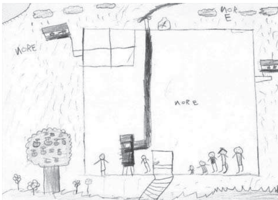
Ryc. 5. Rysunek wykonany przez 10-letniego chłopca

Bardzo ciekawe są rysunki, na których przedstawione są postaci – rodzina oraz koleżanki i koledzy badanych dzieci. W części prac dają się zauważyć złe relacje panujące pomiędzy rodzicami a dziećmi – wyraźnie widać brak bliskości między poszczególnymi członkami rodziny. Na poniższym rysunku centralne miejsce zajmuje postać domu i matki. Wydaje się ona być bardzo agresywna – świadczy o tym groźny wyraz twarzy, czarne, długie włosy wyraźnie narysowane w jednym kierunku, ręce wyciągnięte na boki. Z wypowiedzi 10-letniej dziewczynki wynika, że matka często na nią krzyczy i „ciągle jest zdenerwowana”. Cały namiot pokolorowany jest bordową kredką, a z nieba pada deszcz.