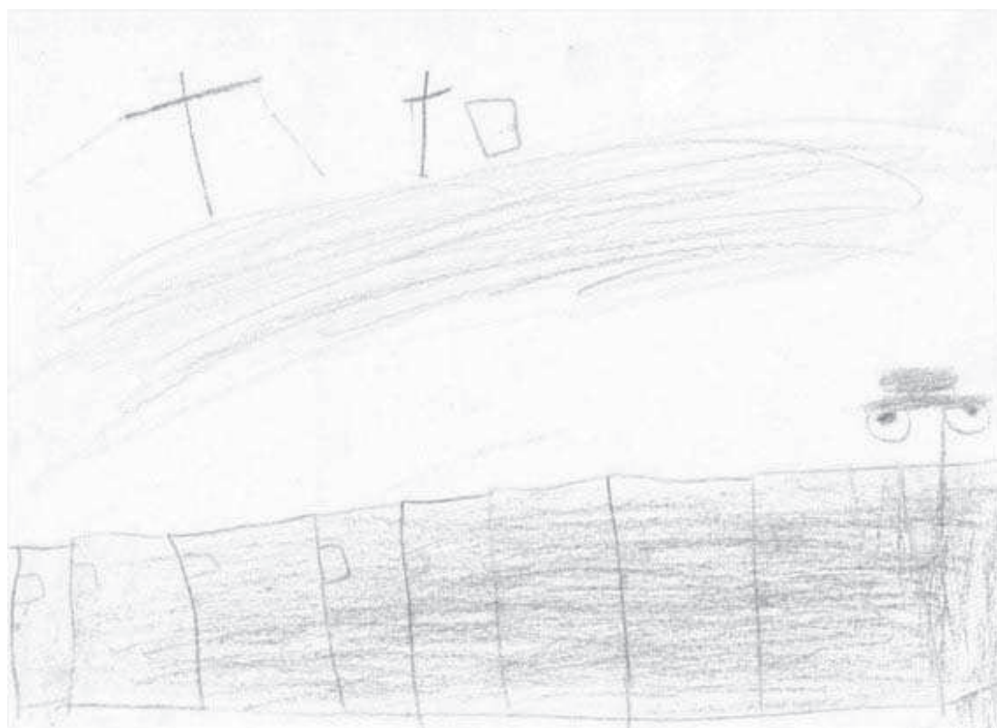
Ryc. 2. Rysunek wykonany przez 12-letniego chłopca

Tylko na jednym rysunku jest stosunkowo dużo szczegółów: domy w Zahle, samochód, drzewa. Jego autorka – 11-letnia dziewczynka w wywiadzie stwierdziła, że: „Narysowałam swój dom, a w nim stół, na którym jest mój tort urodzinowy. Bardzo chciałabym dostać taki tort”. Z rozmowy z dzieckiem dowiedziałam się, że jest to jedno z jej marzeń, które ma nadzieję, że się kiedyś spełni. Dziewczynka narysowała dom i tort, ale nie narysowała siebie i innych postaci. Rysunek sprawia wrażenie „niekompletnego”, martwego i statycznego, w którym brak jest „życia” i radości.