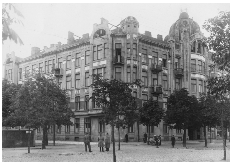
Il. 2. Wygląd kamienicy po przebudowie w 1928 roku – widok od strony skrzyżowania al. Wolności i ul. Boya-Żeleńskiego.