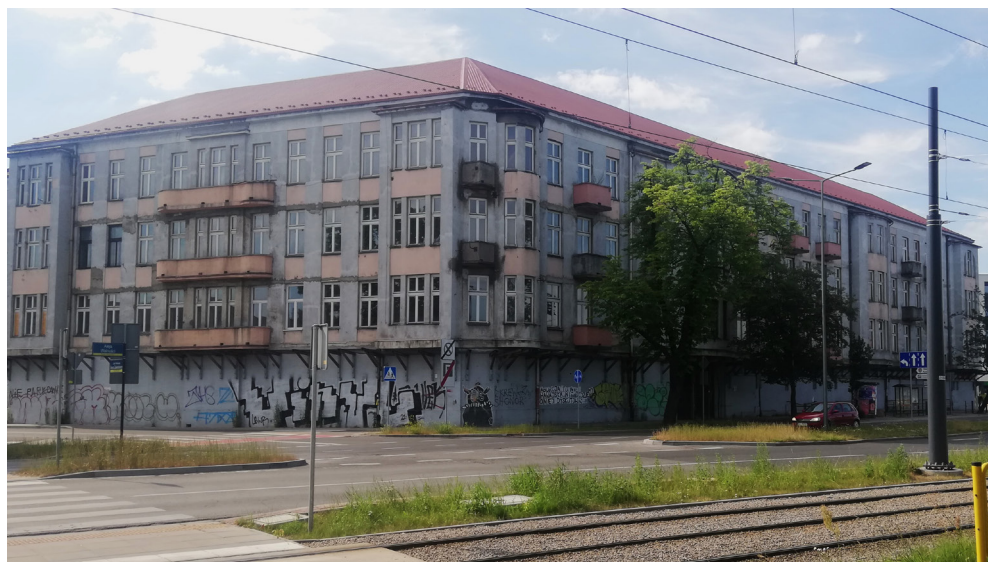
Il. 4. Obecny wygląd kamienicy – widok od strony skrzyżowania al. Wolności i ul. Boya-Żeleńskiego (stan na lipiec 2022 roku).