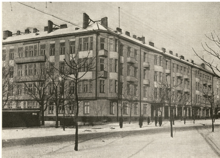
Il. 1. Pierwotny wygląd kamienicy – widok od strony skrzyżowania al. Wolności i ul. Boya-Żeleńskiego.