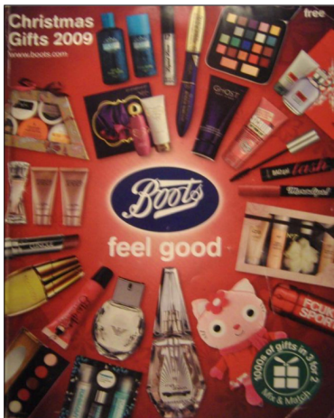
Rycina 4. Okładka katalogu

Ze względu na wizualny charakter katalogu warto przyjrzeć się choć pobieżnie niektórym cechom semiotycznym. Wydrukowany on został na błyszczącym, choć raczej cienkim papierze, a na okładce podano cenę, co wskazuje, iż skierowany jest na rynek towarów średniej jakości. Jego format i wymiary (19 x 23 cm) sprawiają, że mieści się w plecaku, teczce czy większości torebek. Rzut oka na okładkę (ryc. 4) pozwala stwierdzić, że producenci katalogu zaprojektowali go właśnie z myślą o torebkach.