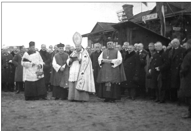
Uroczystość poświęcenia dworca w Radziwiu przez bpa Antoniego J. Nowowiejskiego.

O swoim udziale w uroczystości napisał ks. bp Nowowiejski w liście do sióstr: