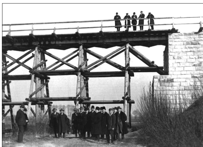
Delegacja z Warszawy na nowym moście na rzece Ochni w Kutnie.

Na stacji w Gostyninie dostojnych gości powitał oddział Ochotniczej Straży Pożarnej z orkiestrą, przedstawiciele władz i społeczeństwa