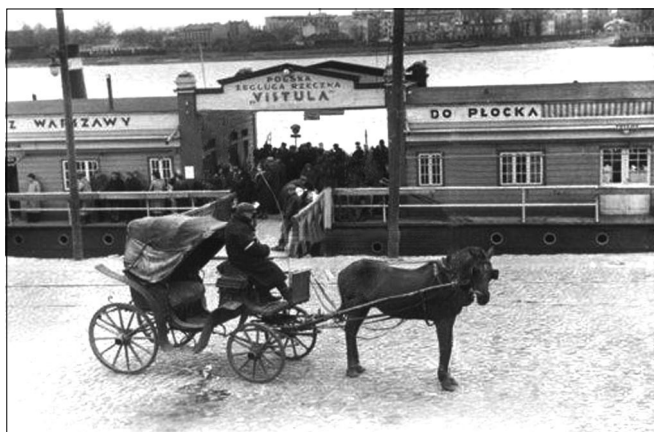
Przystań rzeczna w Warszawie w 1941 r., z której odchodziły statki do Płocka.