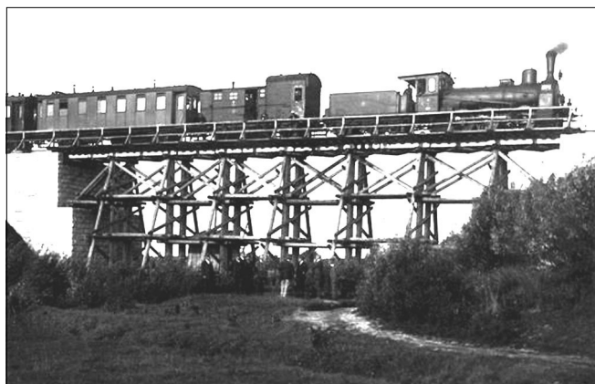
Pociąg na moście na Ochni

„Dziennik Płocki” napisał, że w Kutnie, „w punkcie, gdzie tor się rozdwaja, zbaczając na północ, zwróciła uwagę wszystkich wspaniała, w zieleń i flagi narodowe przybrana brama powitalna, wzniesiona przez personel techniczny budowy. Po jakimś czasie pociąg zwalnia i wreszcie staje na moście rzuconym przez Ochnię, małą i niepokaźną rzeczutką, która jednak w roku ubiegłym w czasie roztopów zdołała