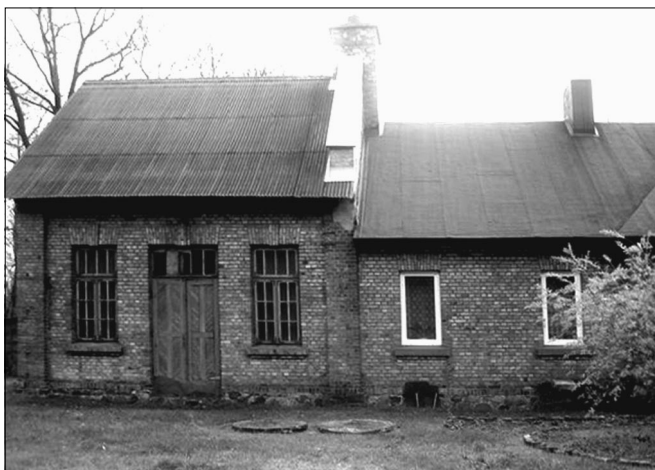
Przepompownia kolejowa w Gostyninie. Stan obecny.