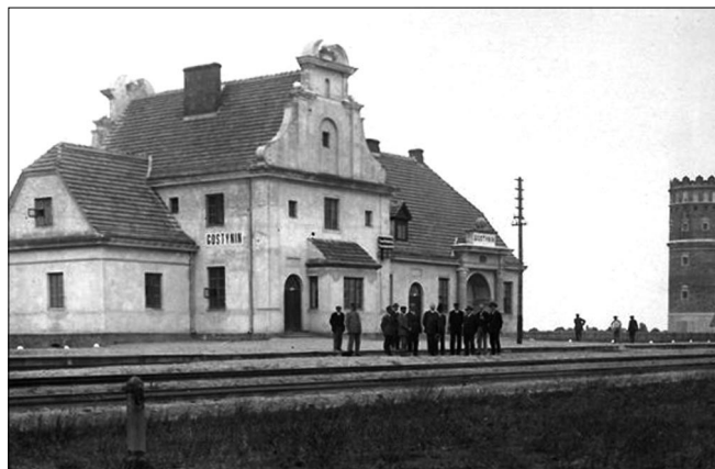
Budynek dworca w Gostyninie. W głębi wieża ciśnień.