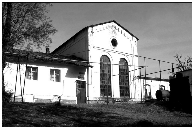
Fot. 18. Gorzelnia w Grodkowie, stan obecny.

zabytków starożytnych (m.in. Korynt i Argolida, Palmyra, Pompeje, Teby).