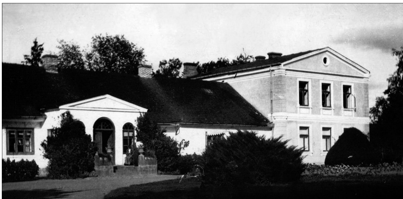
Fot. 3. Dwór w Grodkowie, okres międzywojenny.