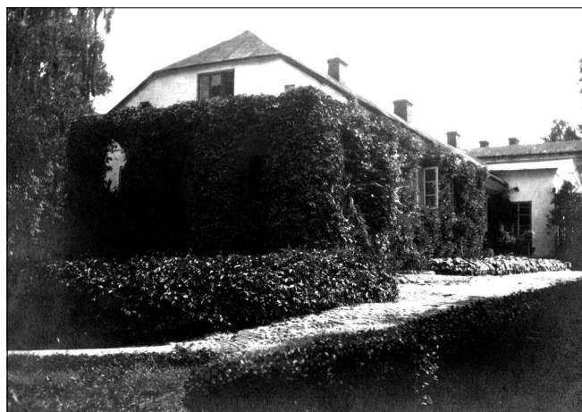
Fot. 5. Dwór w Grodkowie od strony werandy, lata trzydzieste.

Na podstawie wspomnień oraz zachowanych zdjęć można starać się odtworzyć wygląd dworu w Grodkowie i jego otoczenia. Aby dotrzeć do dworu należało skręcić w prawo z szosy wiodącej z Rębowa do Płońska, w wybrukowaną aleję akacjową. Po kilkuset metrach droga się rozchodziła – w prawo skręcało się do gorzelnii, w lewo zaś do dworu. Niedaleko stała też elektrownia wodna, dzięki której dwór posiadał oświetlenie elektryczne. Do dworu wjeżdżało się przez żelazną, zdobioną bramę. Dalej znajdował się okrągły klomb, który objeżdżano piaszczystą drogą. Za tym klombem stał dwór z otynkowanej cegły na kamiennej podmurówce, składający się z dwóch części. Lewa była parterowa, zbudowana w połowie XIX wieku na planie wydłużonego prostokąta, prawa jednopiętrowa, na planie zbliżonym do kwadratu, została zbudowana najprawdopodobniej w latach 20. następnego stulecia. Po lewej stronie starszej, niższej części znajdowała się obrosnięta bluszczem weranda (zob. fot. 5). Przed wejściem do dworu znajdował się nie-wielki murowany ganek. Tył budynku stał na skraju pagórka, poniżej którego były dwa stawy.