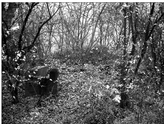
Fot. 19. Pozostałości starej części dworu w Grodkowie od strony ganku, stan obecny.