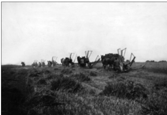
Fot. 7. Żniwa. Zbiory rodzinne

Majątek Dziewanowskich w okresie międzywojennym składał się z trzech folwarków: Grodkowa (477,9 ha), Bietkowic (254,7 ha) oraz Sobanic (484,5 ha). Bietkowice zostały więc najprawdopodobniej odkupione po sprzedaży sprzed 30 lat. W sumie więc powierzchnia majątku wynosiła około 1217 ha. Z tego ziemia uprawna stanowiła (średnio na całym obszarze) 82,3% 49 . Prowadzono tam uprawy, hodowlę oraz gorzelnię. Nie wchodząc w szczegóły, warto tu jednak przedstawić główne pozycje z bilansu całego majątku w okresie od lipca 1928 do lipca 1929 roku. W skali całego przychodu wynoszącego 475 tys. złotych, najważniejszą pozycję stanowiła pszenica (ponad 115 tys. zł), buraki (około 105 tys. zł), spirytus (87,3 tys. zł), owies (35,5 tys. zł), bydło opasowe (35 tys. zł), żyto (28,3 tys. zł) oraz mleko (22,5 tys. zł). Dochód netto wynosił 236,5 tys. zł 50 . Jeśli zaś idzie o sytuację finansową rodziny,