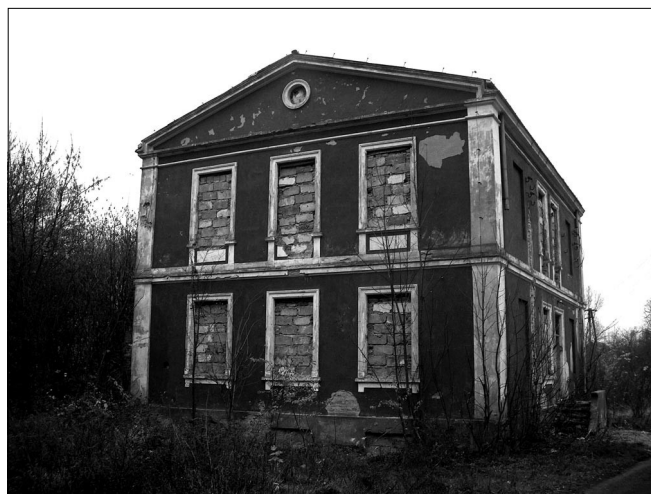
Fot. 20. Dwór w Grodkowie, stan obecny.

Oto jest [...] druga aleja. Brama otwarta, w głębi, za podjazdem błyszczy światło. Wiem, że pali się ono w pokoju jadalnym. Nikt nie czeka na nas z kolacją. Nikt nie powinien się nawet domyślać, że wróciliśmy, że jesteśmy w ogrodzie, że przeszliśmy przez bramę i patrzymy na dom, który jest taki sam, jak w niepowiązanych obrazach fotoplastykonu wywiezionego stąd przez dziewięcioletniego chłopca. Nie będziemy zaglądali przez okno. Gdybyśmy to zrobili, ludzie siedzący w środku ujrzeliby zza szyby dwie twarze upiórów, które wróciły. Jesteśmy upiorami, lecz nikogo nie chcemy przstraszyć. Dwa taktowne upiory ze świadomością, że powrót tutaj nie jest w porządku wobec ludzi, którzy siedzą w naszym pokoju jadalnym. Za chwilę przepadniemy na następne dwadzieścia trzy lata albo na zawsze. Jak wszystkie upiory nic nie chcemy, prócz jednego: jeszcze raz zobaczyć. Dlatego przeszliśmy przez bramę. Chytkiem, pod drzewami obchodzimy podjazd i oto jesteśmy już pod domem. Jest taki sam jak wtedy. Oddaliliśmy się od niego o pięć lat wojny i kilkanaście lat pokoju innego niż ten, który tu wtedy panował. Dom wciąż jest, choć nie ma połowy jego ówczesnych mieszkańców. [...]