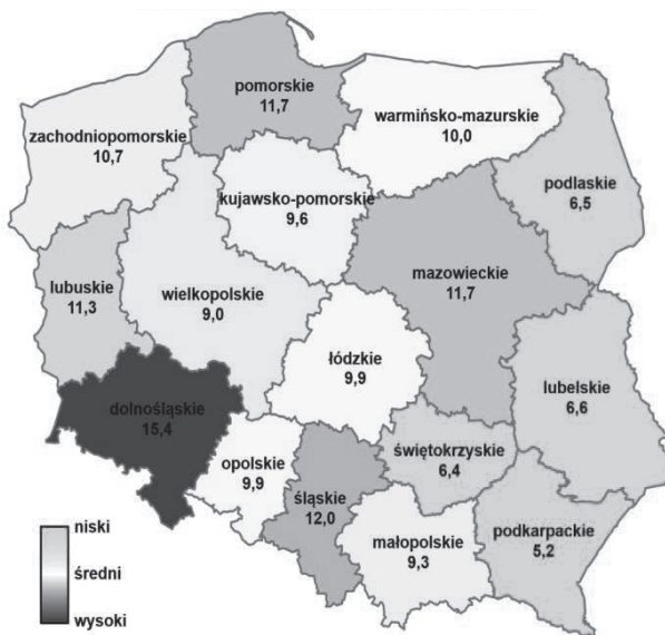
Rys. 6. Wskaźnik przestępczości przeciwko mieniu