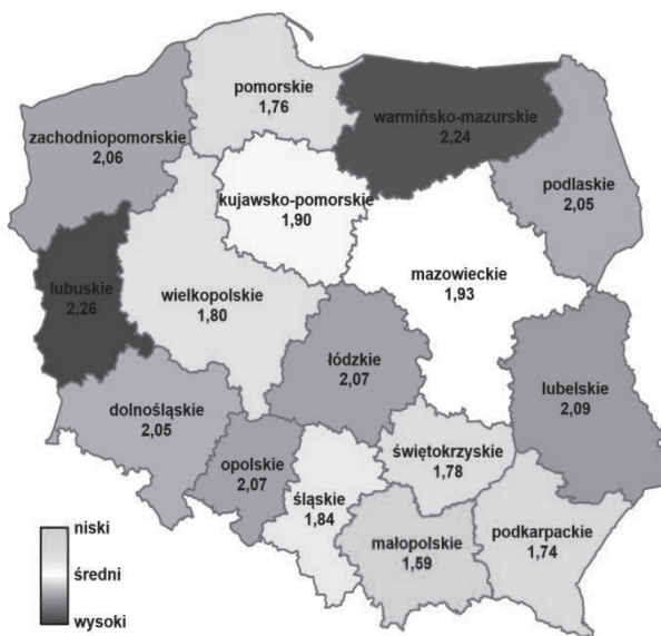
Rys. 4. Wskaźnik przestępczości o charakterze drogowym