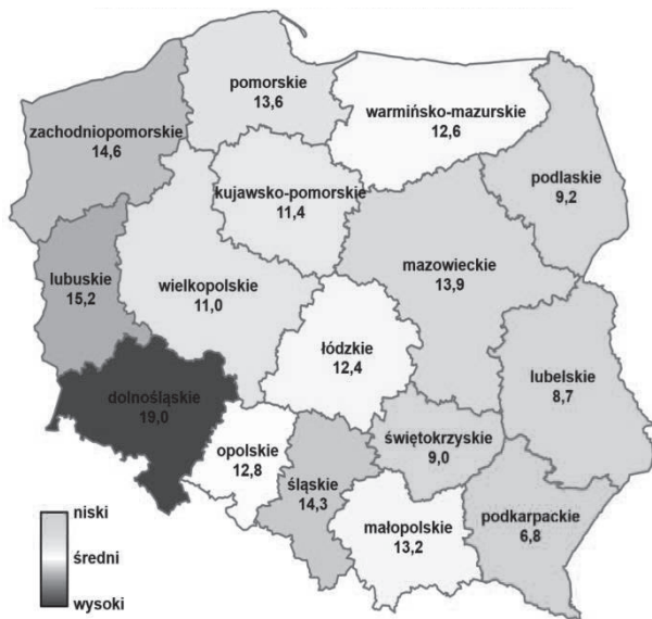
Rys. 2. Wskaźnik przestępczości o charakterze kryminalnym