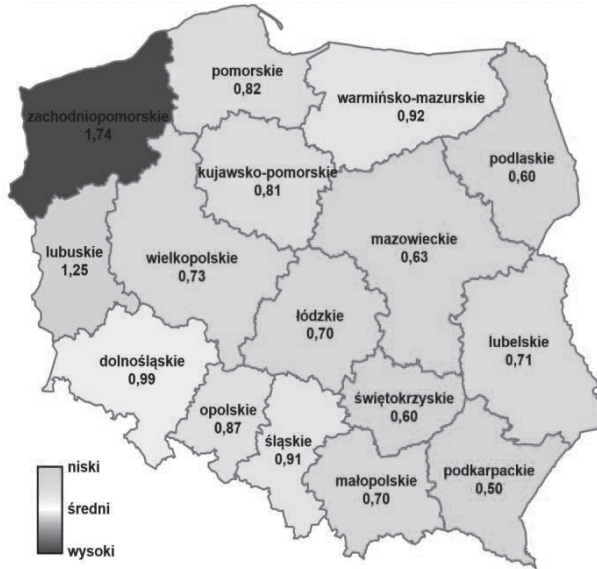
Rys. 7. Wskaźnik przestępczości przeciwko wolności, wolności sumienia i wyznania, wolności seksualnej i obyczajności