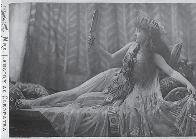
Ryc. 5. Lily Langtry jako Kleopatra, za: www.shmoop.com , data wejścia 30 X 2009