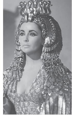
Ryc. 6. Elizabeth Taylor, za: www.threadforthought.net , data wejścia 5 IV 2008