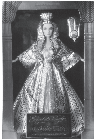
Ryc. 17. Lalka Barbie inspirowana rolą Elisabeth Taylor jako Kleopatry

Również moda chętnie nawiązuje do wizerunku starożytnej władczyni, kreując fryzury i stroje zainspirowane jej osobą — jak te projektu A. McQueena czy Lalki Barbie z twarzą Elizabeth Taylor w stroju Kleopatry (ryc. 17).