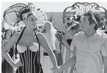
Ryc. 9. Monica Bellucci, za: Cleopatra thru the Ages , www.time.com , data wejścia 25 VI 2010