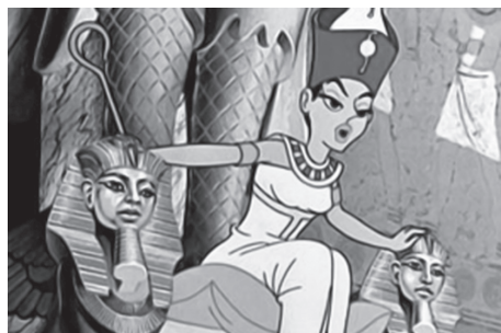
Ryc. 8. Kleopatra — kadr z filmu animowanego o Asterixie i Obelixie (1965)

Postać ostatniej władczyni Egiptu przedstawiano w reklamie telewizyjnej jako ekspertki dbania o ciało. W spotach Luksji z lat 90. ubiegłego wieku pojawiała się w wannie wypełnionej mlekiem, piękna i ponętna z aksamitną skórą. Współczesna kobieta przez nabycie produktu miała poczuć się tak samo. Nawet logo owej firmy nawiązuje do jej starożytnych przedstawień. Z kolei IKEA wiosną 2009 roku rozpoczęła kampanię „Ty tu urządzisz”, której pierwszy spot wykorzystywał postać Kleopatry przeciwstawiającej się matce Antoniusza, chcącej zmienić wnętrze pałacu egipskiej władczyni.