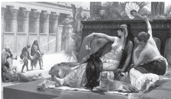
Ryc. 4. Alexander Cabanel, Kleopatra testuje truciznę na niewolnikach (1897), za: www.allart.biz , data wejścia 15 XII 2009