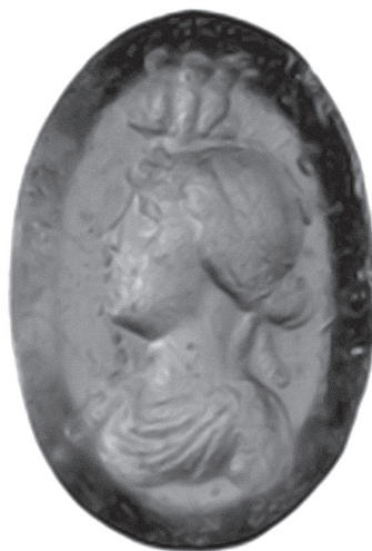
Ryc. 14. Szklana gemma z prawdopodobnym przedstawieniem egipskiej królowej; ze zbiorów British Museum GR 1923.4-1.676 (Gem 3085), za: www.britishmuseum.org , data wejścia 4 I 2010