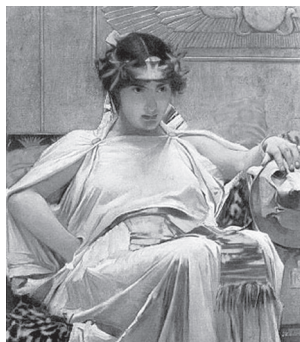
Ryc. 3. John William Waterhouse, Cleopatra, za: www.jwwaterhouse.com , data wejścia 15 XII 2009

bijąca z jej postawy w połączeniu z próżnością i zbytkiem ukazuje Kleopatę jako uosobienie niemoralnego, lecz bogatego Wschodu — tajemniczego, a jednocześnie intrygującego. Malarze również ukazywali moment śmierci Kleopatry, co doskonale opisał A. Łukaszewicz 16 . Utrwalali w ten sposób przekaz, jakoby królowa sama zadała sobie śmierć, zawarty w tendencyjnych źródłach 17 . Pozwolę sobie jedynie przypomnieć, że królowa była przeróżnie ukazana: naga, ubrana w szaty z epoki artysty lub w królewskie odzienie, sama lub ze służbą, ale zawsze z wężem, żmiją lub kilkoma gadami tych gatunków, zarówno w momencie samobójstwa, jak i po nim.