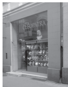
Ryc. 15 i 16. Logo Salonu Piękności oraz sklepu z biżuterią w Poznaniu, których nazwy, afisz i witryna nawiązują do Kleopatry VII

Odeszła bo dotknęło ją Najsilniejsze uczucie pod Słońcem