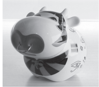
Ryc. 20. Skarbonka zainspirowana postacią Kleopatry, za: www.empik.com , data wejścia 12 I 2010

Razem z wizerunkiem maski Tutenchamona i popiersia Nefretete Kleopatra często jest przedstawiana na pamiątkach dla turystów z Egiptu, „papierusach”, zastawie stołowej czy rzeźbach służących dekoracji domu. Te trzy postacie, jak wcześniej wspomniano, funkcjonują obecnie jako symbole historii egipskiej, faraonowie i starożytni władcy, stąd mnogość różnego typu artykułów sygnowanych ich wizerunkiem lub imieniem.