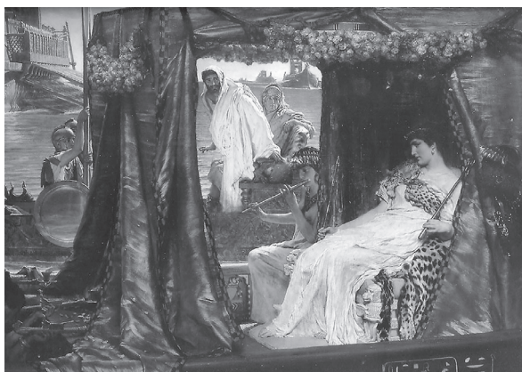
Ryc. 2. Lawrence Alma-Tadema, Anthony and Cleopatra (1885), za: www.alma-tadema.org , wejście 13 III 2009