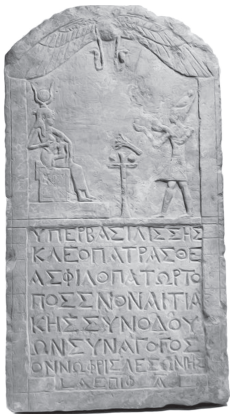
Ryc. 11. Stela ukazująca Kleopatrze VII jako faraona składającego ofiarę bogini Izydzie. Ekspонат Muzeum w Luwrze nr inw. E 27113, za: www.louvre.fr , data wejścia 13 XI 2008

Z wyjątkiem historyków nikt nie zastanawia się nad faktem, czy rzeczywiście Kleopatra była piękna, a nawet dowiedzenie, że w rzeczywistości miała przeciętną urodę, nie wpłynęłoby znacząco na zmianę jej wizerunku w kulturze popularnej — nadal jest symbolem urody i czaru 31 . Nie wiemy nic lub bardzo niewiele o jej wyglądzie zewnętrznym, gdyż zachowane posągi, reliefy i emisje monetarne ukazują nam stylizowany portret władczyni (ryc. 11–14).