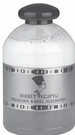
Ryc. 10. Na opakowaniu płynu do kąpieli użyto popiersia Nefretete jako znaku graficznego i nazwy „kąpiel Kleopatry”.

Kleopatra VII jako starożytna piękność zdradza sekrety pielęgnacji urody mogące nadal służyć współczesnej kobiecie w poprawie wyglądu 29 . Co ciekawe, niektóre kosmetyki sygnowane imieniem Kleopatry, jako znaku graficznego czasami używają popiersia Nefretete — kolejny przykład zlania się dwóch starożytnych piękności w jedno (ryc. 10). Różnego rodzaju maseczki, sole do kąpieli, żele pod prysznic mają zapewnić konsumentkom skórę taką, jaką miała królowa, dać im namiastkę kąpieli w mleku. Problem w tym, że żadne źródło nie potwierdza, iż królowa kąpała się w tym specyfiku — jest to kolejny stereotyp, który być może został wywołany wykorzystywaniem przez afrykańskie i arabskie kobiety naturalnych produktów w pielęgnacji 30 . Firma Tocca, ulegając być może podobnym wpływom, wypuściła serię perfum, z których jeden zapach zawierający nutki tuberozy, jaśminu i grapefruita otrzymał nazwę „Cleopatra”.