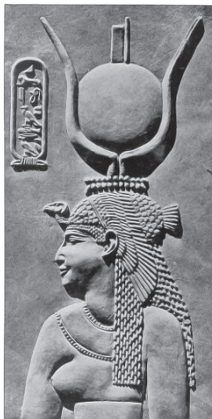
Ryc. 12. Płaskorzeźba ukazująca przypuszczalny portret Kleopatry jako bogini Hathor w świątyni w Denderze. Relief z Deir el Bahri