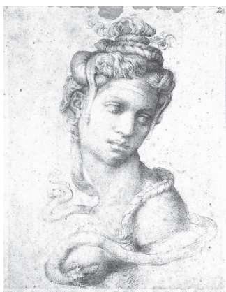
Ryc. 1. Michelangelo Buonarroti, Kleopatra, 1533/1534, grafika 35×25 cm, Galleria degli Uffizi we Florencji, fotografia za: www.lib-art.com , data wejścia 12 VII 2009

Piękna i uwodzicielska władczyni ukazana jest w różnych momentach swego życia, od zasiadania na tronie, poprzez sprawdzanie działania trucizn na niewolnikach, a na spotkaniu z Antoniuszem kończąc. Duma i wyniosłość