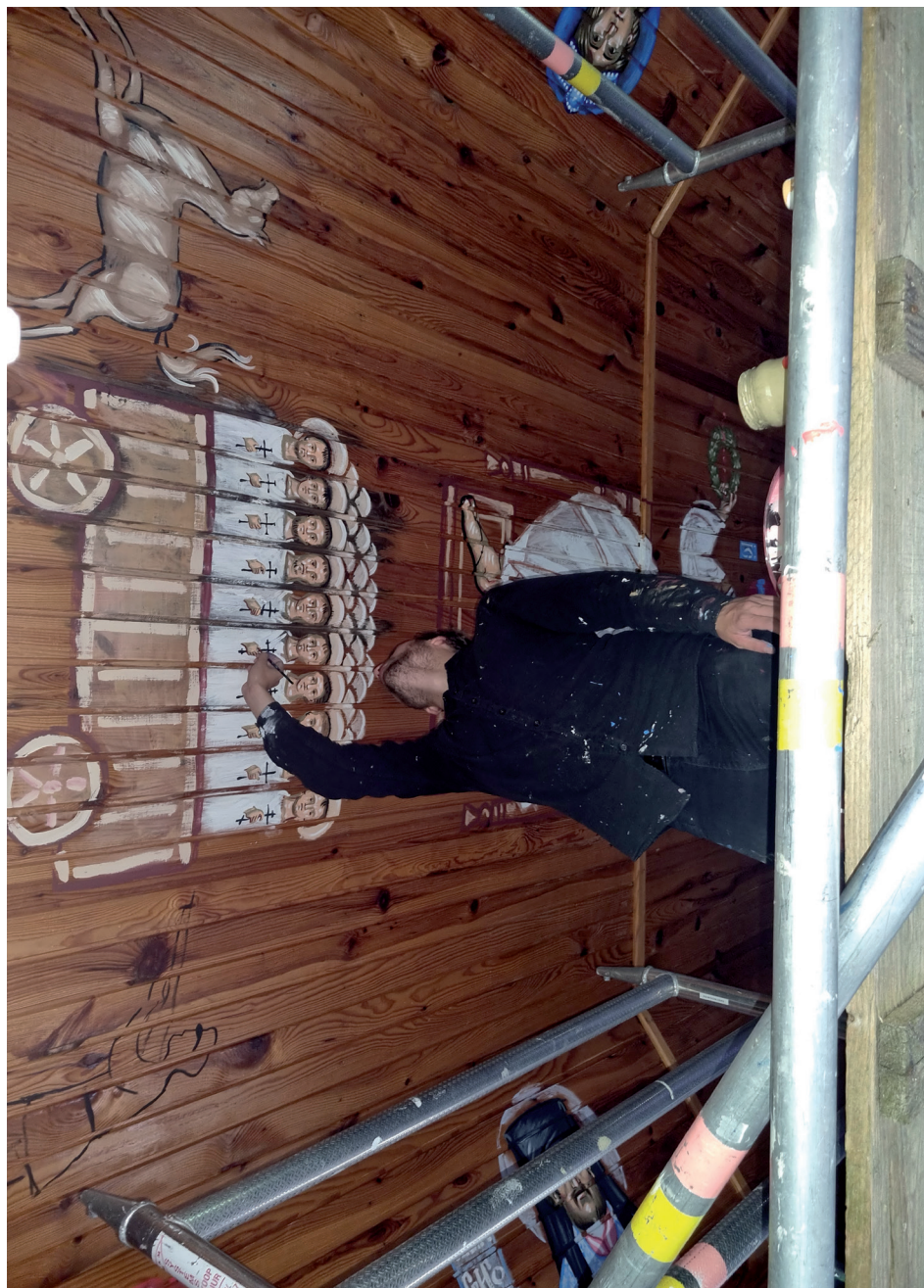
Wizerunek Furmanów – Męczenników Podlaskich w trakcie powstawania.