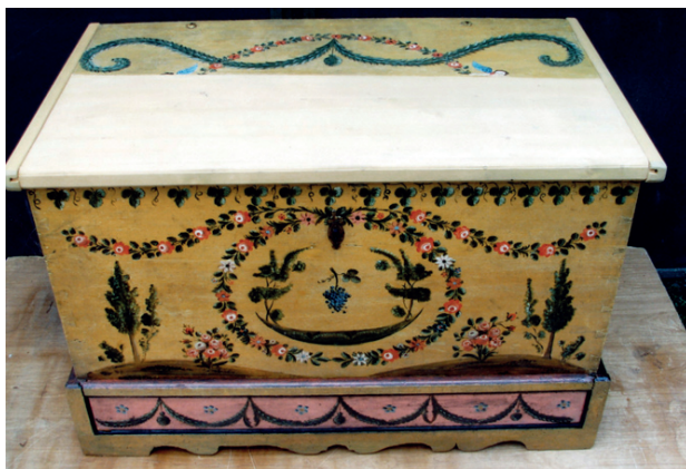
Fot. 6. Skrzynia nr MR/E 480, stan po konserwacji

W 2009 roku przeprowadzono konserwację kolejnych dwóch skrzyń ze zbiorów raciborskiego muzeum – nr inw. MR/E 301 pochodzącą z terenu Śląska Opolskiego z XIX wieku oraz nr inw. MR/E 222 ze zbiorów przedwojennego Heimatmuseum in Ratibor. Postępowanie konserwatorskie prowadzone było podobnie, jak przy obiektach opisywanych uprzednio. Oczyszczono i zdezynfekowano oraz wzmocniono części drewniane skrzyń. Zrekonstruowano brakujące elementy w drewnie świerkowym, uzupełniono mniejsze ubytki kitem trocinowym. Nałożono na dorobione elementy oraz w miejscach przetarć zaprawę kredowo-klejową, po jej wyschnięciu – warstwę werniksu damarowo-woskowego i uzupełniono polichromię metodą punktowania płamką lub kreską. Użyto odsączonych z nadmiaru spoiwa farb olejnych (cynober ciemny, lazur zielony, żółć kadmowa, zieleń chromowa ciemna, umbra, sepia, czerni lampowa), rozcieńczonych terpentyną wenecką 32 .