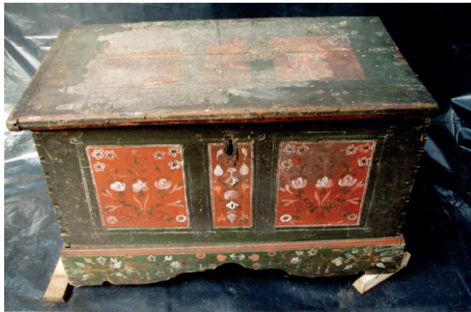
Fot. 5. Skrzynia nr MR/E 1774, stan przed konserwacją

z Bieńkowic (powiat raciborski), wykonano z drewna iglastego łączonego za pomocą czopów, dno przytwierdzono kołkami, boki i front ozdobiono polichromią wykonaną w technice olejnej na zaprawie kredowo-klejowej. Drewno skrzyni było mocno naruszone przez owady, złącza desek rozესchnięte i luźne, zachowały się tylko trzy kółka oderwane od całości, z których jedno było niewymiarowe. Żelazne uchwyty i zamek pokryte były rdzą. Stwierdzono spore ubytki zaprawy kredowo-klejowej pod polichromią. Na wieku znajdowało się bardzo duże zaplamienie (fot. 5). Założono przeprowadzenie konserwacji technicznej i częściowo estetycznej. Polichromię wieka odczyszczano mechanicznie, zdejmując kolejne warstwy skalpelem. Naprawiono podstawę skrzyni, zrekonstruowano kółka i oś oraz listwę blatu w drewnie świerkowym. Mniejsze ubytki drewna uzupełniono kitem trocinowym firmy Sintilor. Sklejono pęknięcia i złącza drewna klejem stolarsko-kostnym (klejenie podstawy i listwy blatu wzmocniono kołkami bukowymi). Na dorobione elementy oraz w miejscach przetarć nałożono zaprawę kredowo-klejową. Po jej wyschnięciu nałożono warstwę werniksu damarowo-woskowego i uzupełniono polichromię metodą punktowania płamką lub kreską. Użyto odsączonych z nadmiaru spoiwa farb olejnych (cynober ciemny, lazur zielony, żółć kadmowa, zieleń chromowa ciemna, umbra, sepia, czerń lampowa) rozcieńczonych terpentyną wenecką. Metalowe części odczyszczono i zabezpieczono capon-lakiem 29 .