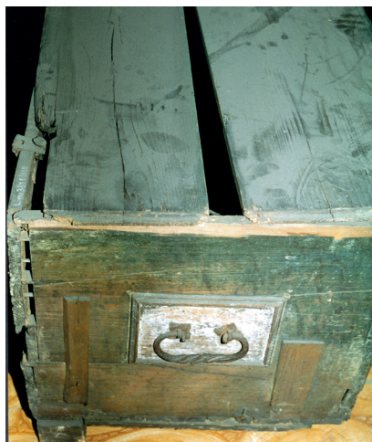
Fot. 1. Skrzynia ludowa malowana, MR/E 481, stan przed konserwacją

Skrzynia nr MR/E 481 była mocno zniszczona przez szkodniki biologiczne, drewno było rozeschnięte i popękane, w wielu miejscach występowały uszkodzenia mechaniczne. Elementy metalowe były skorodowane (fot. 1). Polichromia zachowała się fragmentarycznie, najlepiej na ścianie frontowej, a na płaszczyznach bocznych – śladowo, brakowało jej na wieku i z tyłu skrzyni. Polichromia wykonana została farbami temperowymi bezpośrednio na drewnie, jedynie w niektórych partiach ściany przedniej – na warstwie bardzo cienkiej zaprawy kredowej.