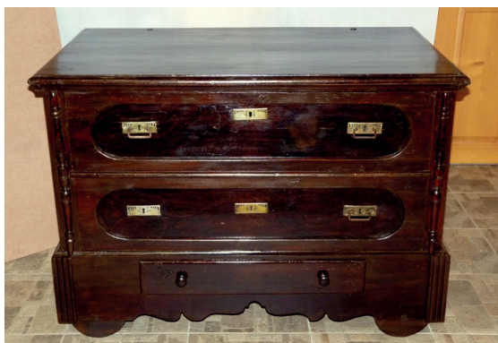
Fot. 7. Skrzynia-pseudokomoda nr MR/E 1775, stan po konserwacji

wiejskiej. W 2. połowie XIX wieku zaczęto przerabiać istniejące malowane skrzynie ludowe, by upodobnić je do miejskich komód. Skrzynia nr inw. MR/E 1775 pochodząca z Raciborza ma od frontu imitację szuflad, ale otwierana jest tradycyjnie od góry – wiekiem (fot. 7). Zachowały się w niej pierwotne, tradycyjne elementy konstrukcyjne skrzyni – kółka, drewniane osie, półskrzynek, które nie występują w przypadku komody. W trakcie konserwacji odkryto, że imitację płycin i szuflad oraz fladrowanie położono na pierwotną polichromię z podziałami geometrycznymi i ornamentami roślinnymi, które niestety zachowały się śladowo (na bokach około 40%, na frontowej ścianie 5%, na wieku niezachowana). W związku ze słabym zachowaniem pierwotnej polichromii podjęto decyzję, że w ramach konserwacji estetycznej zostanie odczyszczone i uzupełnione fladrowanie skrzyni. Po wyschnięciu zaprawy nałożono warstwę werniksu damarowo-woskowego i uzupełniono polichromię farbami olejnymi rozcieńczonymi terpentyną wenecką techniką punktowania plamką lub kreską, następnie położono laserunek imitujący słoje drewna. Rekonstruowane elementy drewniane scalono kolorystycznie z drewnem oryginalnych części za pomocą brązowej bejcy do drewna firmy Sintilor i zawoskowano 34 .