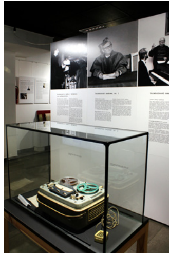
Fot. 1–4. Wystawa „Życie jako pieśń. Z teki profesora Adolfa Dygacza”