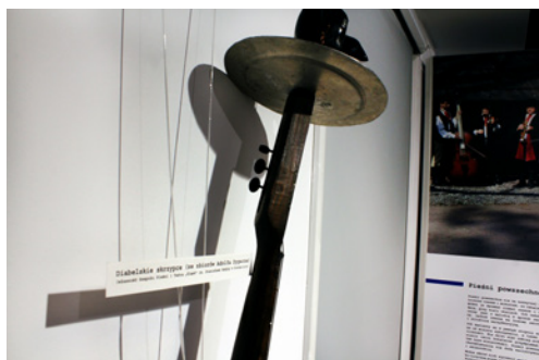
Fot. 1–4. Wystawa „Życie jako pieśń. Z teki profesora Adolfa Dygacza”