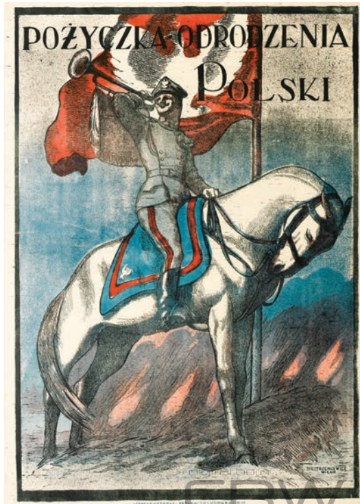
Il. 4. Plakat autorstwa Stanisława Siestrzeńcewicza ze zbiorów Centralnej Biblioteki Wojskowej im. Marszałka Józefa Piłsudskiego