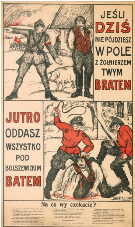
Il. 2. Plakat autorstwa Jerzego Edwarda Winiarza