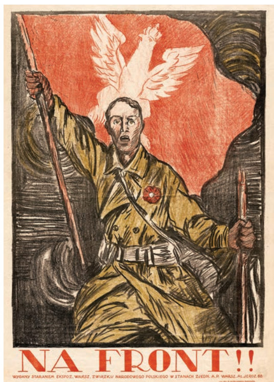
Il. 6. Plakat autorstwa Witolda Gordona ze zbiorów Centralnej Biblioteki Wojskowej im. Marszałka Józefa Piłsudskiego