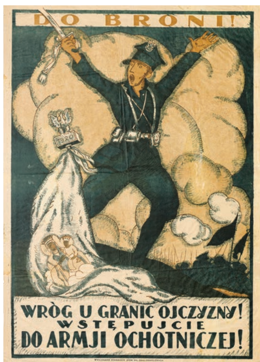
Il. 5. Plakat autorstwa Jerzego Edwarda Winiarza ze zbiorów Centralnej Biblioteki Wojskowej im. Marszałka Józefa Piłsudskiego