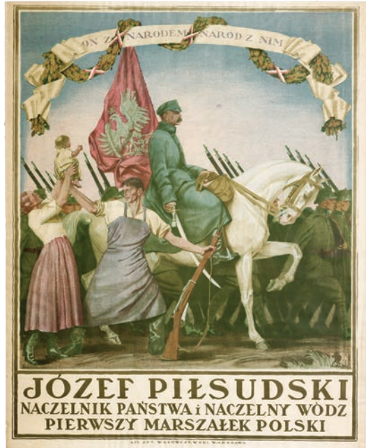
Il. 3. Plakat ze zbiorów Centralnej Biblioteki Wojskowej im. Marszałka Józefa Piłsudskiego