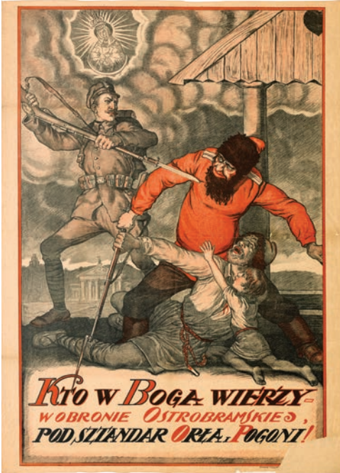
Il. 1. Plakat