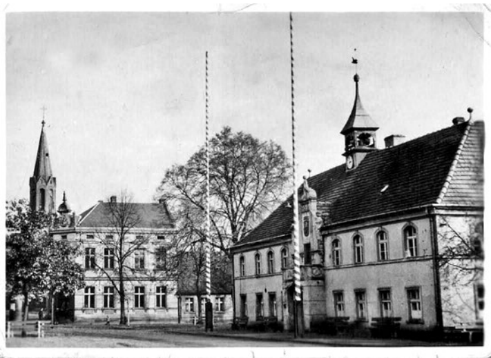
Ilustracja 1. Na pierwszym planie ratusz w Czerwieńsku, a także siedziba biblioteki zlokalizowanej na parterze po lewej stronie od głównego wejścia do gmachu