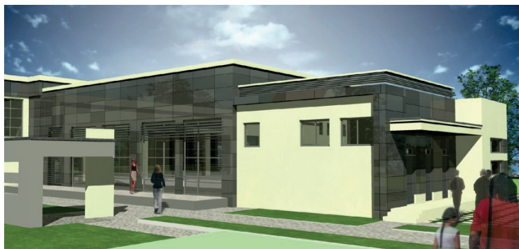
Zdjęcie 2. Planowany budynek Regionalnego Centrum Ratownictwa w Witnicy

Rok 2008 – podpisanie porozumienia o współpracy partnerskiej w zakresie ochrony przeciwpożarowej i ochrony przed katastrofami oraz w zakresie ratownictwa pomiędzy Powiatem Gorzowskim a Powiatem Marchijsko-Odrzańskim.