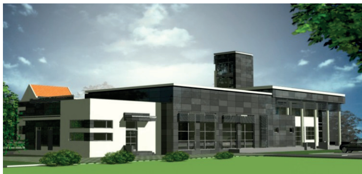
Zdjęcie 1. Planowany termin oddania do użytku Regionalnego Centrum Ratownictwa w Witnicy – koniec roku 2011